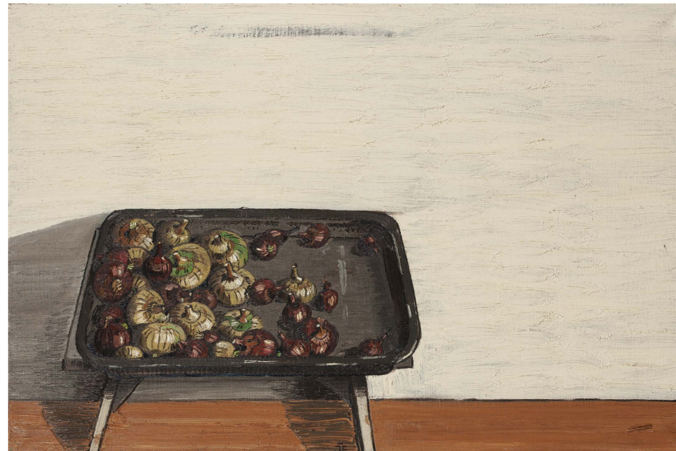
Cibule | Onions 2015, olej na plátne | oil on canvas, 60 x 90 cm