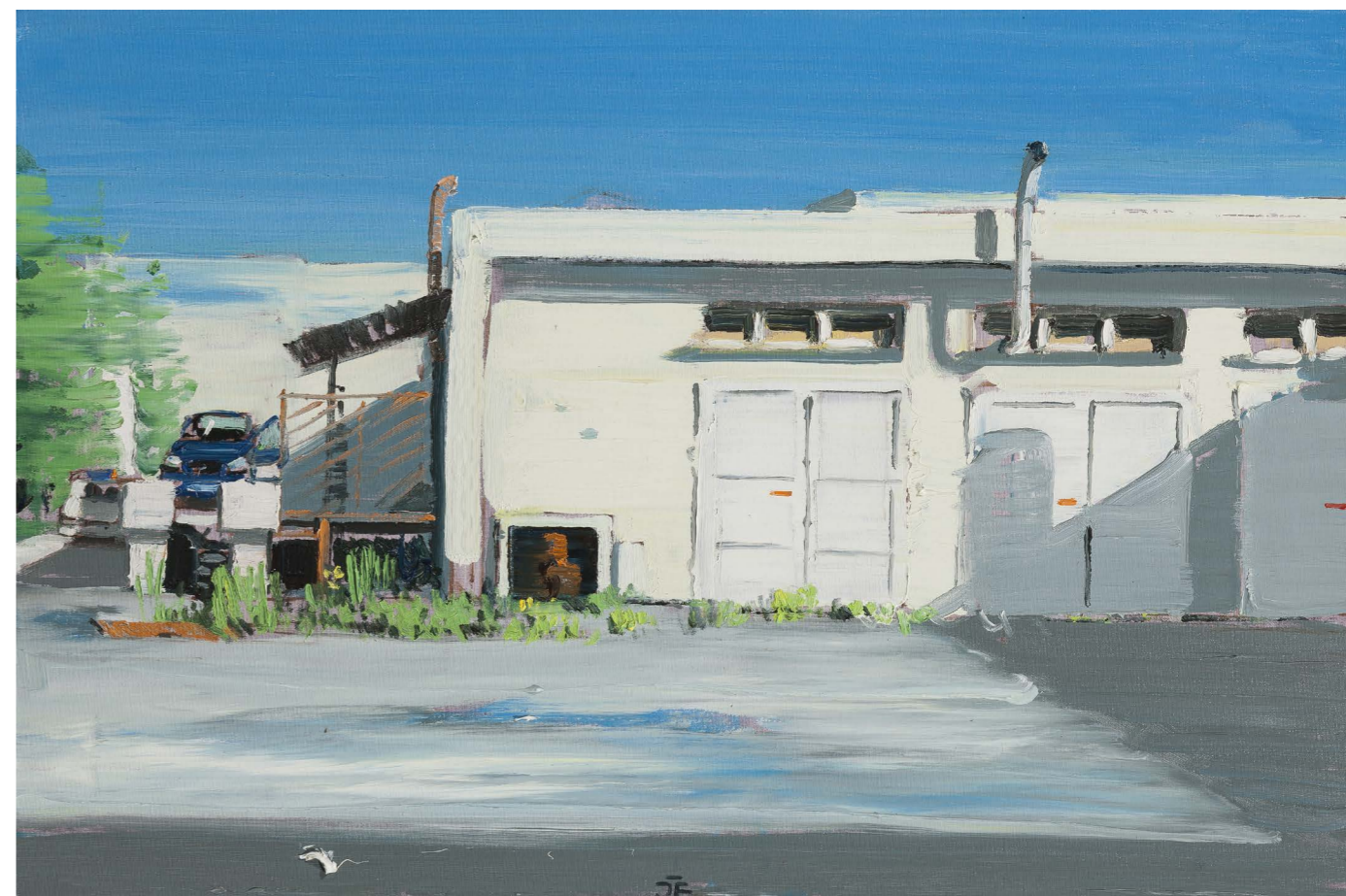
Nemocnica – kotolňa | The Hospital - Boiler-House 2017, olej na plátne | oil on canvas, 40 x 60 cm