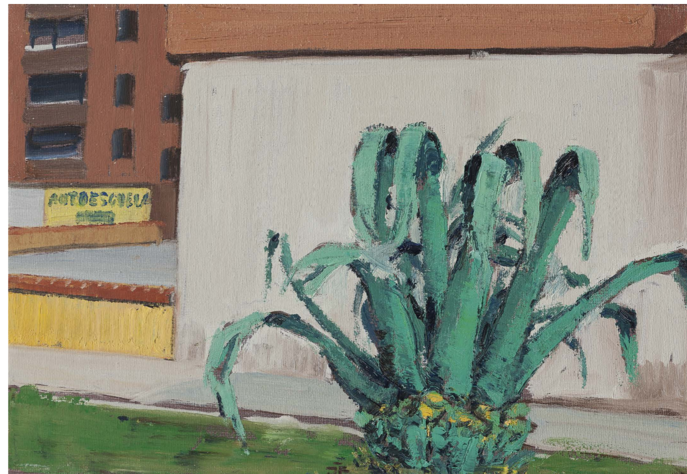
Aloe Vera (zo série Avilés) | Aloe Vera (from the Avilés series) 2017, olej na plátne | oil on canvas, 24 x 35 cm