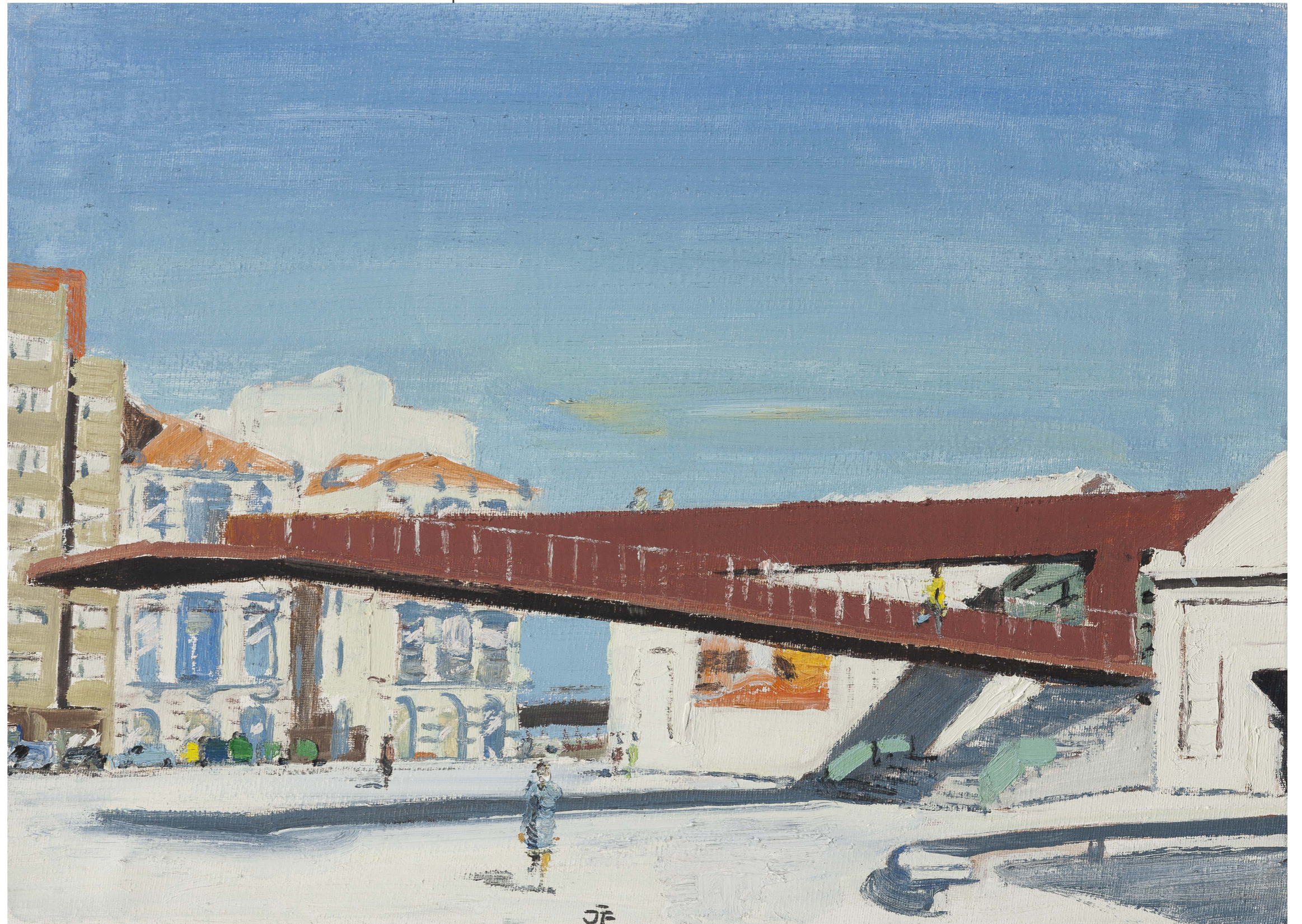
Niemeyer Center Avilés 2017, olej na plátne | oil on canvas, 33 x 46 cm