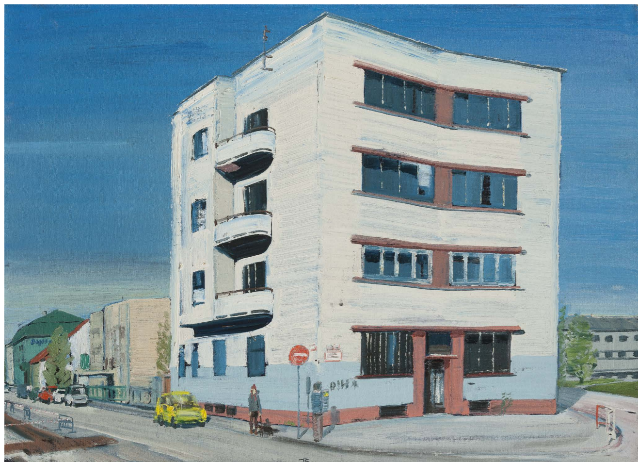
Dom A. Jescha (zo série Žilina) | A. Jesch House (from Žilina series) 2016, olej na plátne | oil on canvas, 65 x 90 cm