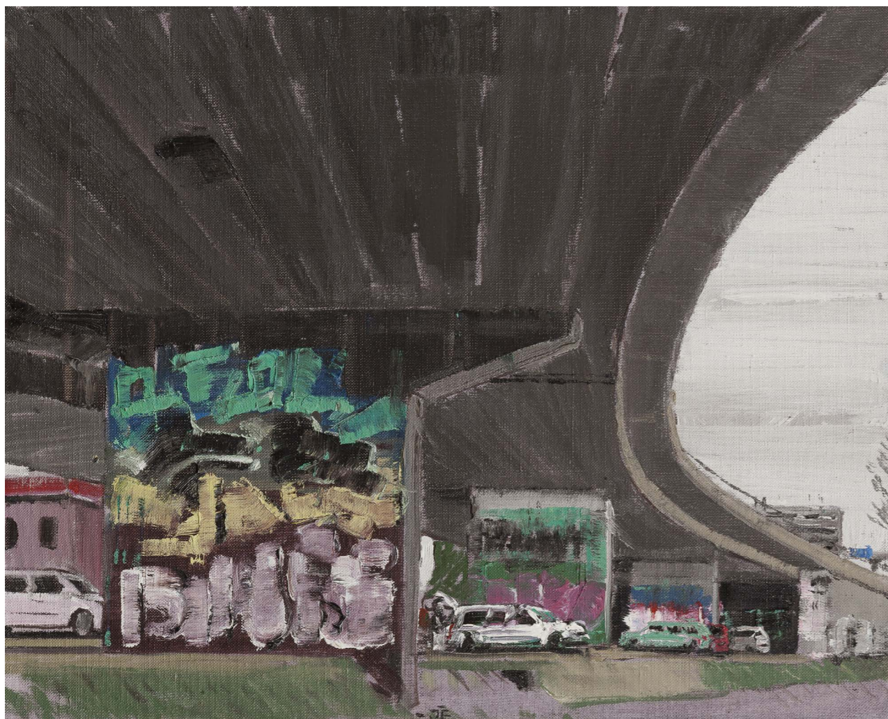
Mosty – Rondel II (zo série Žilina) | Bridges – Rondel II (from the Žilina series) 2016, olej na plátne | oil on canvas, 40 x 50 cm