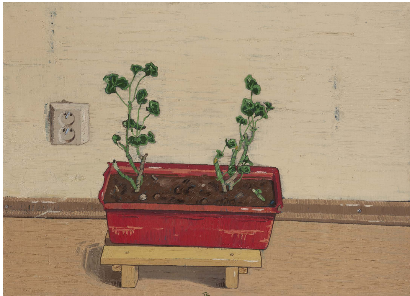
Muškáty | Pelargonium 2015, olej na plátne | oil on canvas, 65 x 90 cm