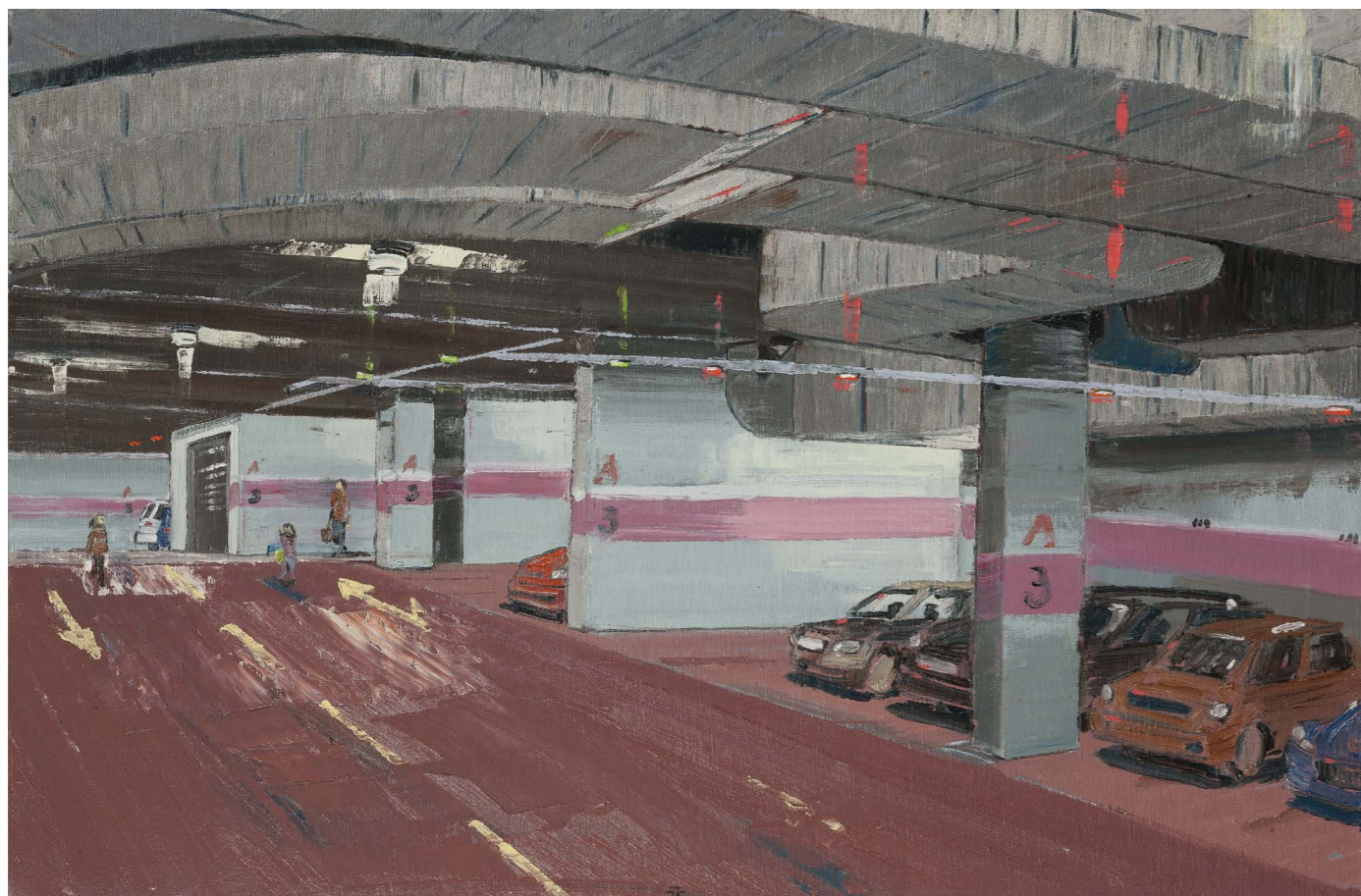
Podzemné garáže A | Underground Parking Garages A 2016, olej na plátne | oil on canvas, 60 x 90 cm