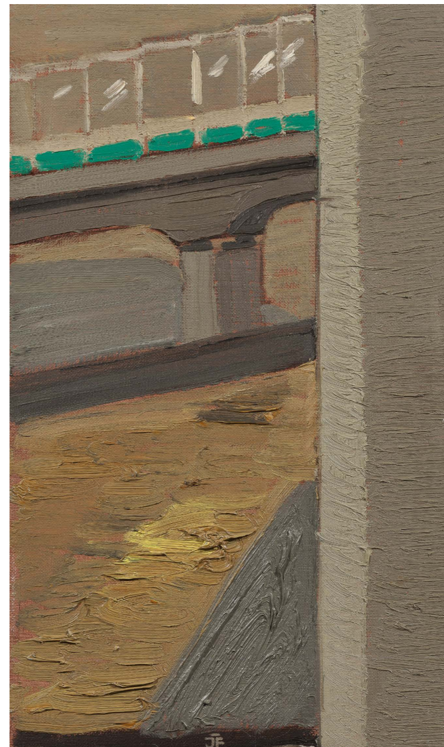
Urbánný nezmar | Urban Diehard 2013, olej na plátne | oil on canvas, 50 x 30 cm