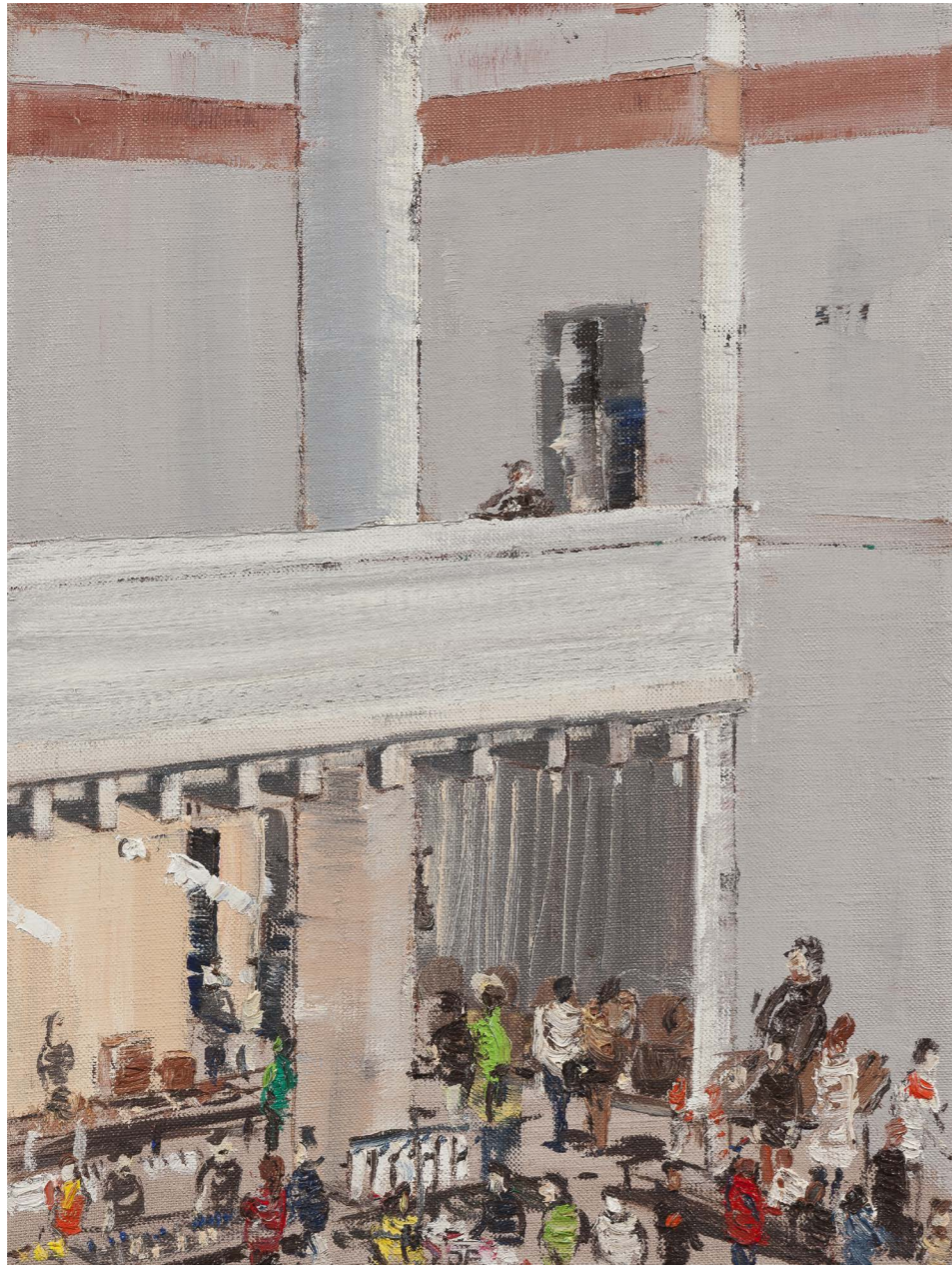
Synagóga – vianočný trh | Synagogue – X-mas Market 2016, olej na plátne | oil on canvas, 40 x 30 cm