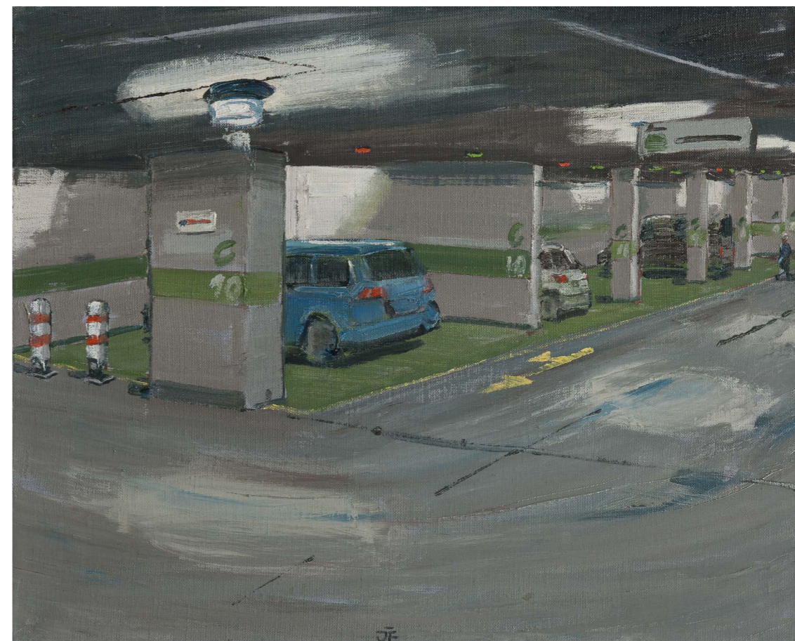
Podzemné garáže C | Underground Parking Garages C 2016, olej na plátne | oil on canvas, 40 x 50 cm