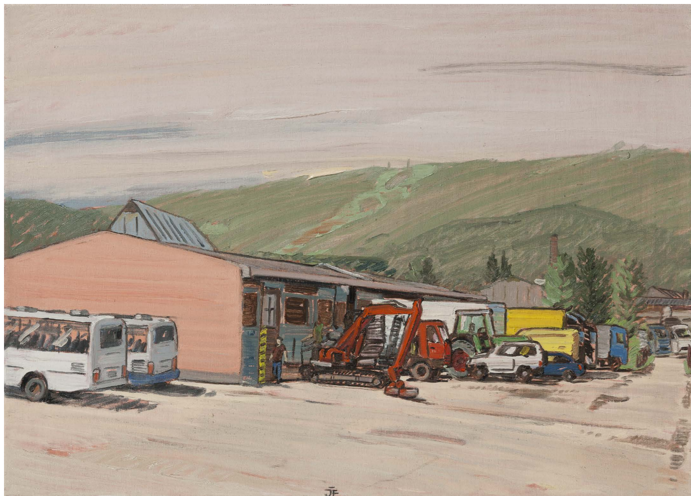
Hospodársky dvor I | Farm Yard I 2016, olej na plátne | oil on canvas, 50 x 70 cm