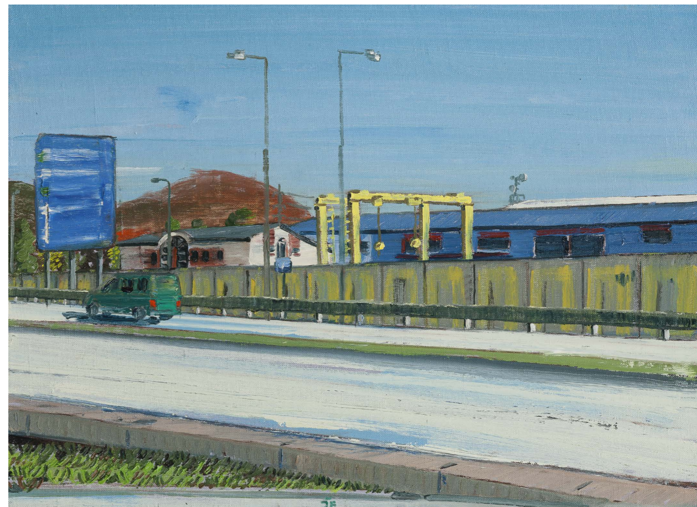
Pri Tescu (zo série Žilina) | Near to the Tesco (from the Žilina series) 2016, olej na plátne | oil on canvas, 40 x 55 cm