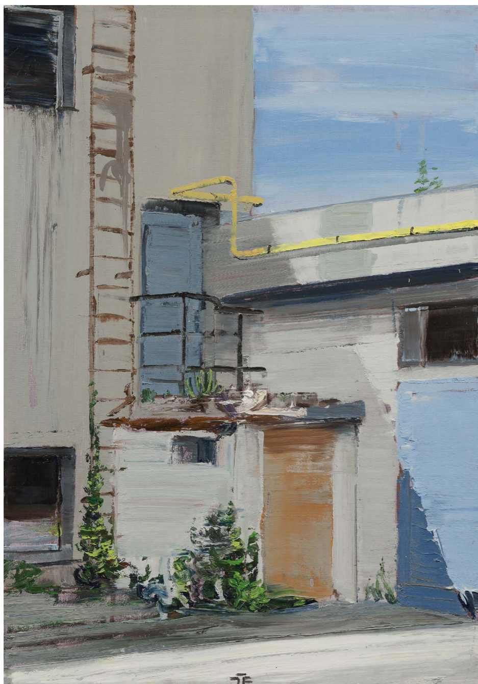
Nemocnica – Stalkerské zákutie | The Hospital – Stalker's Nook 2017, olej na plátne | oil on canvas, 50 x 35 cm