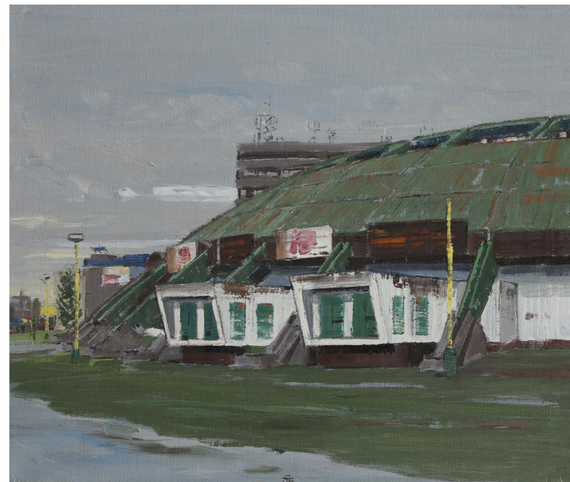
Opustená športová hala (zo série Žilina) | Abandoned Sporthall (from Žilina series) 2016, olej na plátne | oil on canvas, 50 x 60 cm