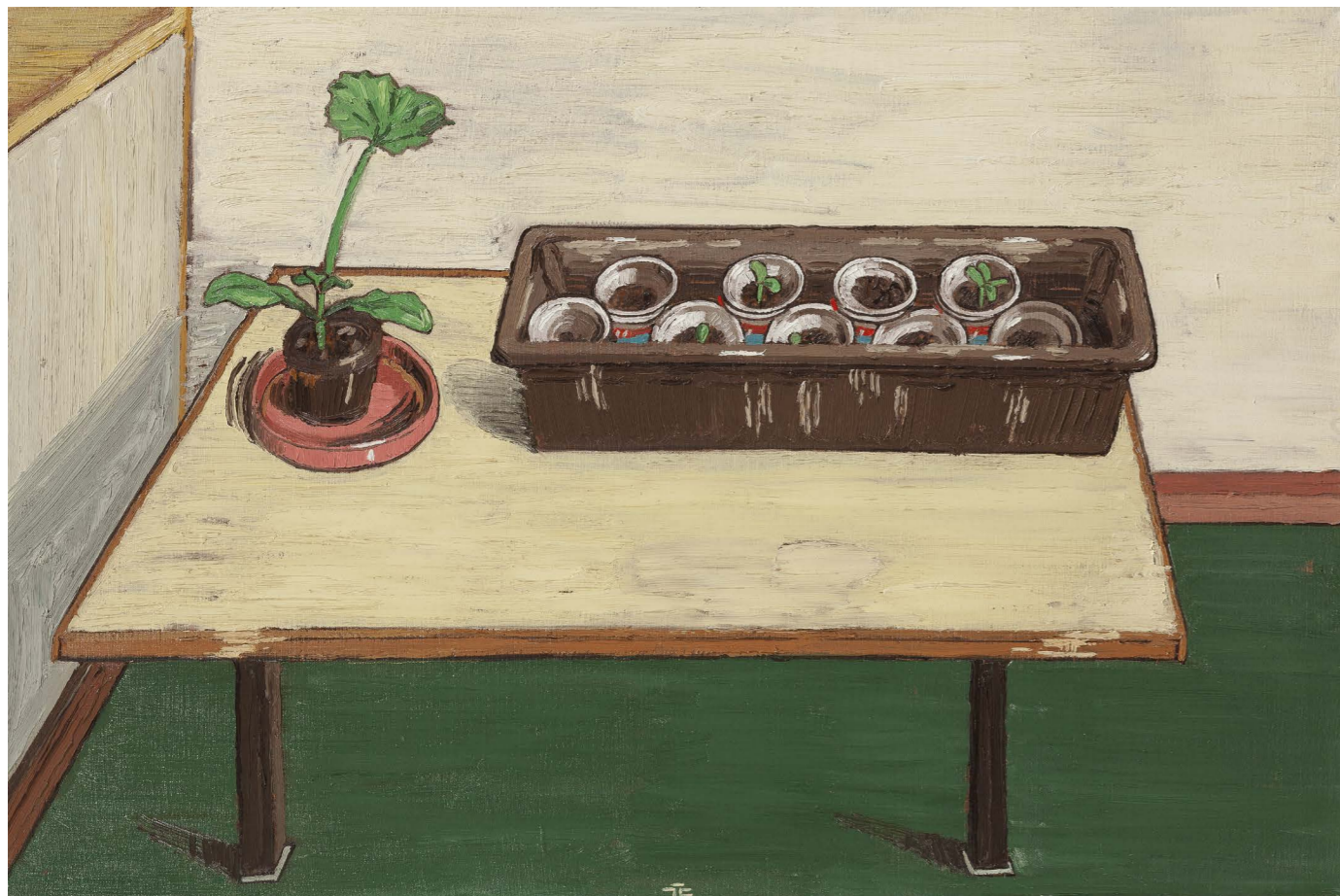
Cuketa & uhorky | Zucchini & Cucumbers 2015, olej na plátne | oil on canvas, 60 x 90 cm