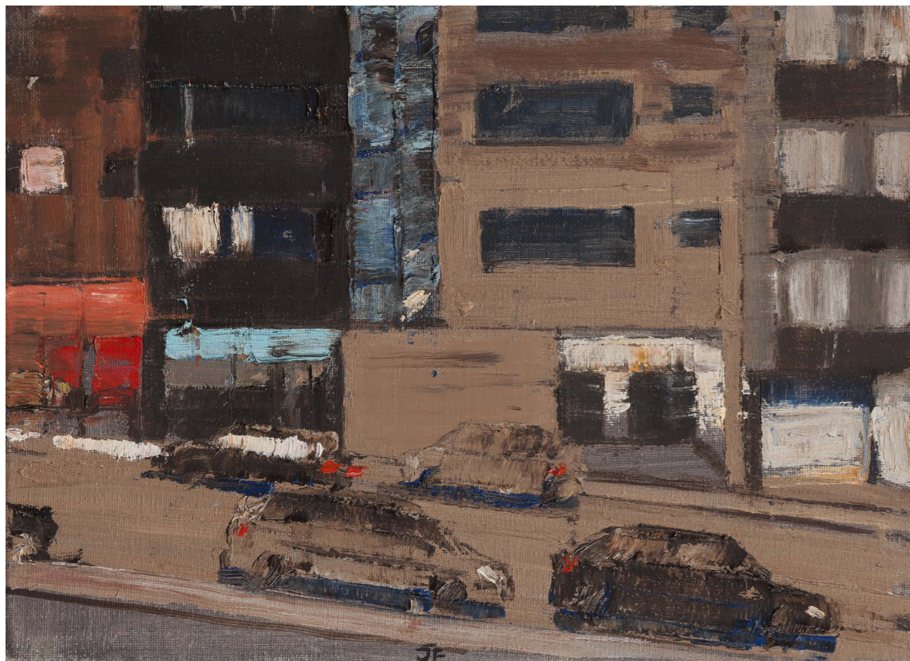
Edificio Fuero (zo série Avilés) | Edificio Fuero (from the Avilés series) 2017, olej na plátne | oil on canvas, 24 x 33 cm