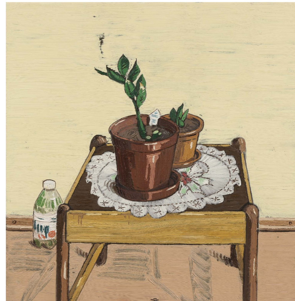
Neznáme kvety | Unknown Flowers 2015, olej na plátne | oil on canvas, 60 x 60 cm