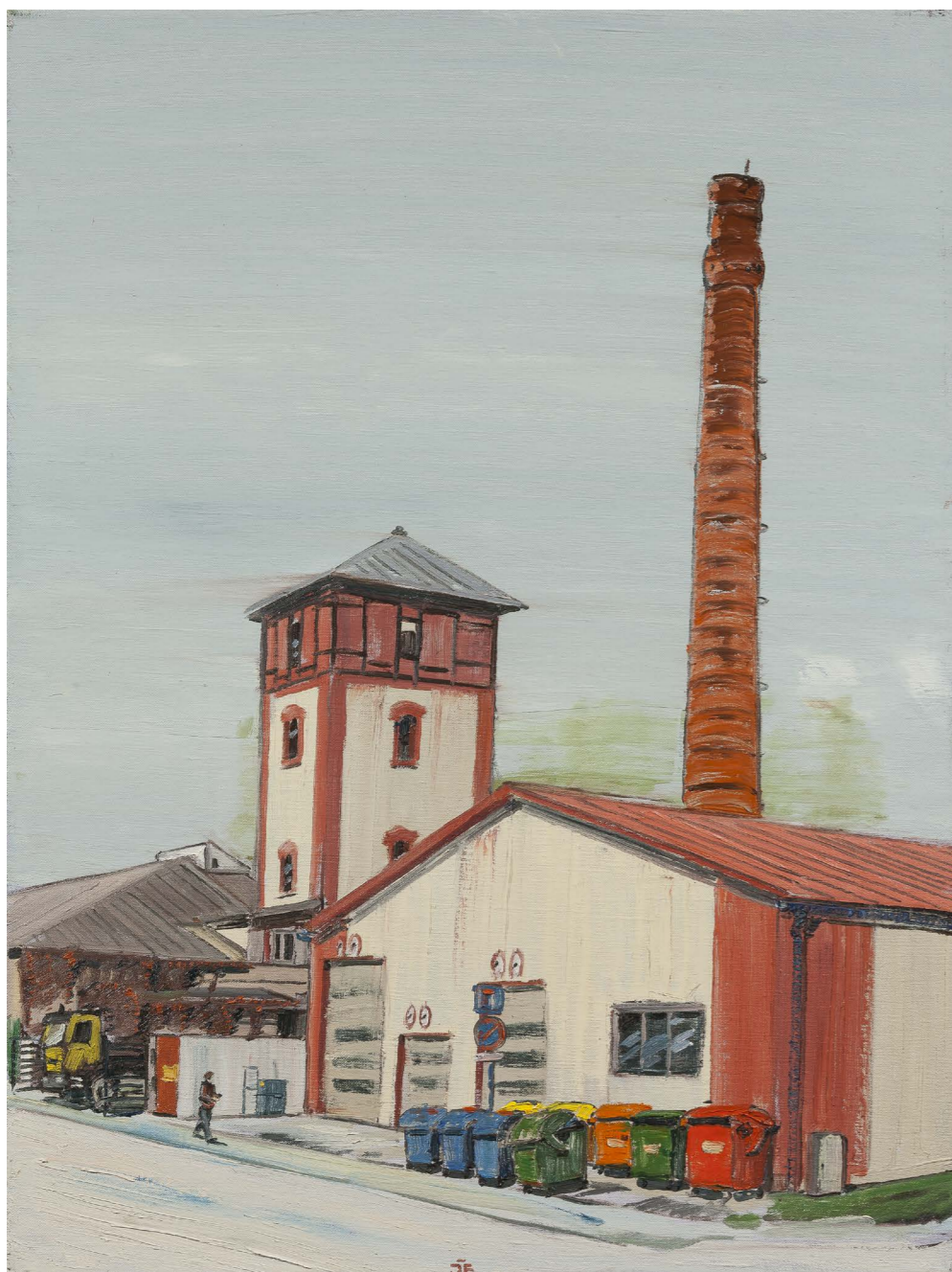
Zápalkáreň (zo série Žilina) | Matches Factory (from Žilina series) 2016, olej na plátne | oil on canvas, 80 x 60 cm