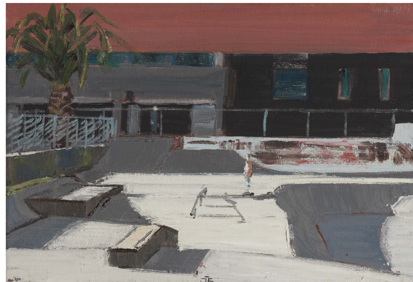
Skatepark (zo série Avilés) | Skatepark (from the Avilés series) 2017, olej na plátne | oil on canvas, 24 x 33 cm