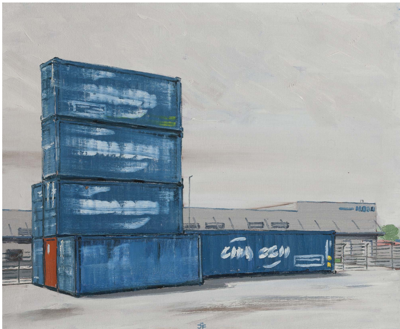
Kontajnery zo série Žilina | Containers from the Žilina series 2016 olej na plátne | oil on canvas 46 x 56 cm