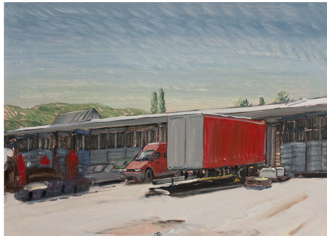
Hospodársky dvor II | Farm Yard II 2016, olej na plátne | oil on canvas, 50 x 70 cm