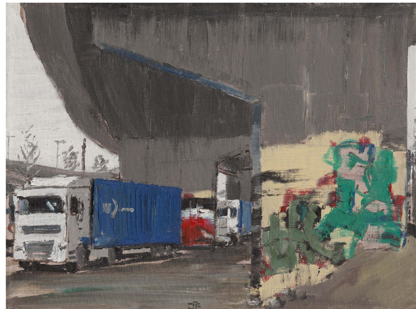
Imisped – Rondel I (zo série Žilina) | Imisped – Rondel I (from the Žilina series) 2016, olej na plátne | oil on canvas, 30 x 40 cm