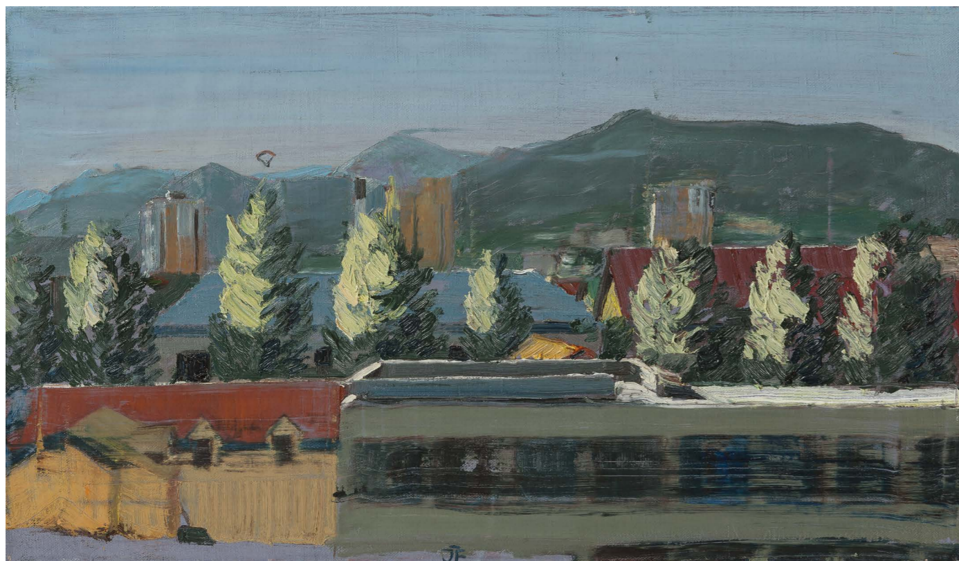
Alej slobody (Dolný Kubín) | Freedom Alley (Dolný Kubín) 2016, olej na plátne | oil on canvas, 35 x 60 cm