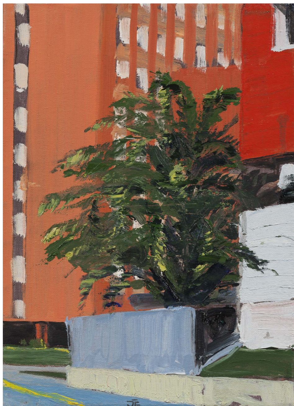
Palmara (zo série Avilés) | Palmara (from the Avilés series) 2017, olej na plátne | oil on canvas, 33 x 24 cm