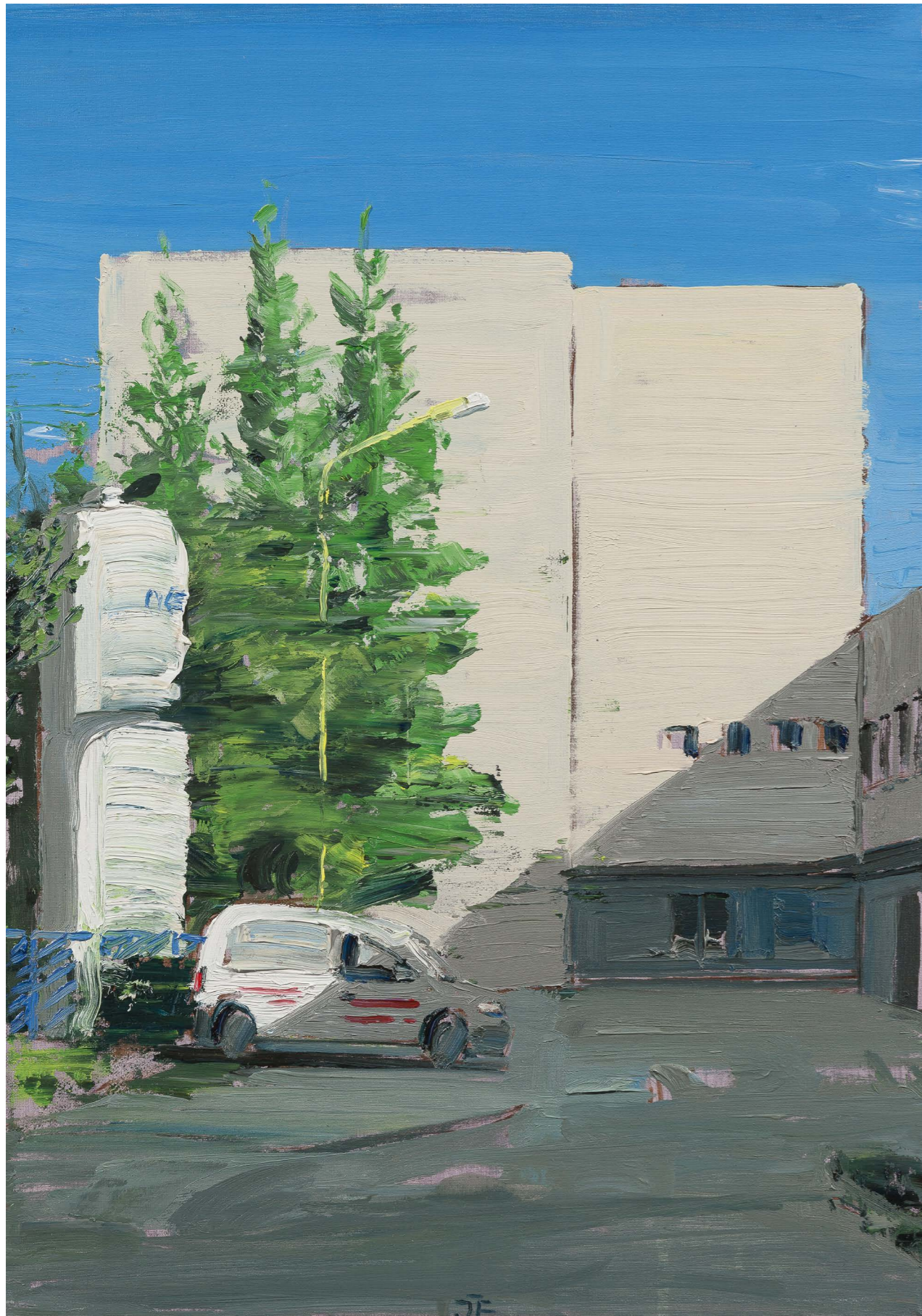
Nemocnica | The Hospital 2017, olej na plátne | oil on canvas, 50 x 35 cm