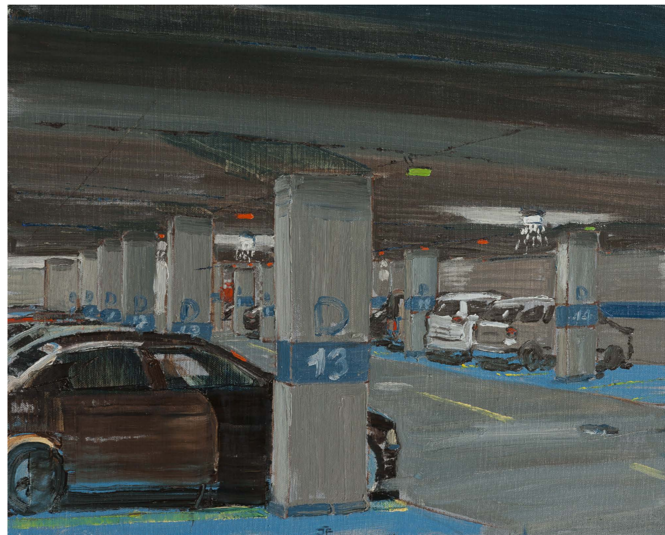
Podzemné garáže D | Underground Parking Garages D 2016, olej na plátne | oil on canvas, 50 x 90 cm