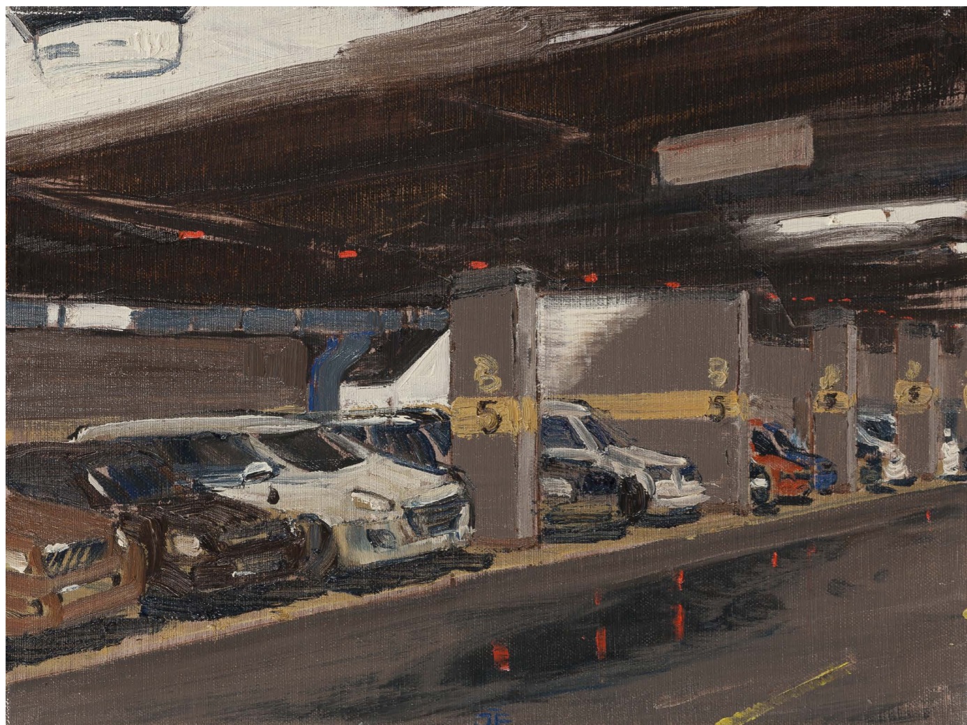
Podzemné garáže B | Underground Parking Garages B 2016, olej na plátne | oil on canvas, 30 x 40 cm