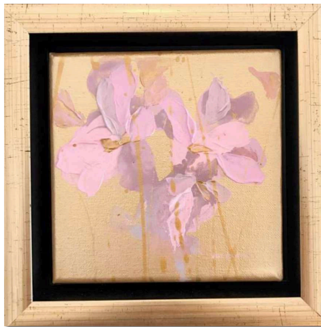
Candy VI. Akryl na plátne 12 x 12 cm, 2019 250 eur