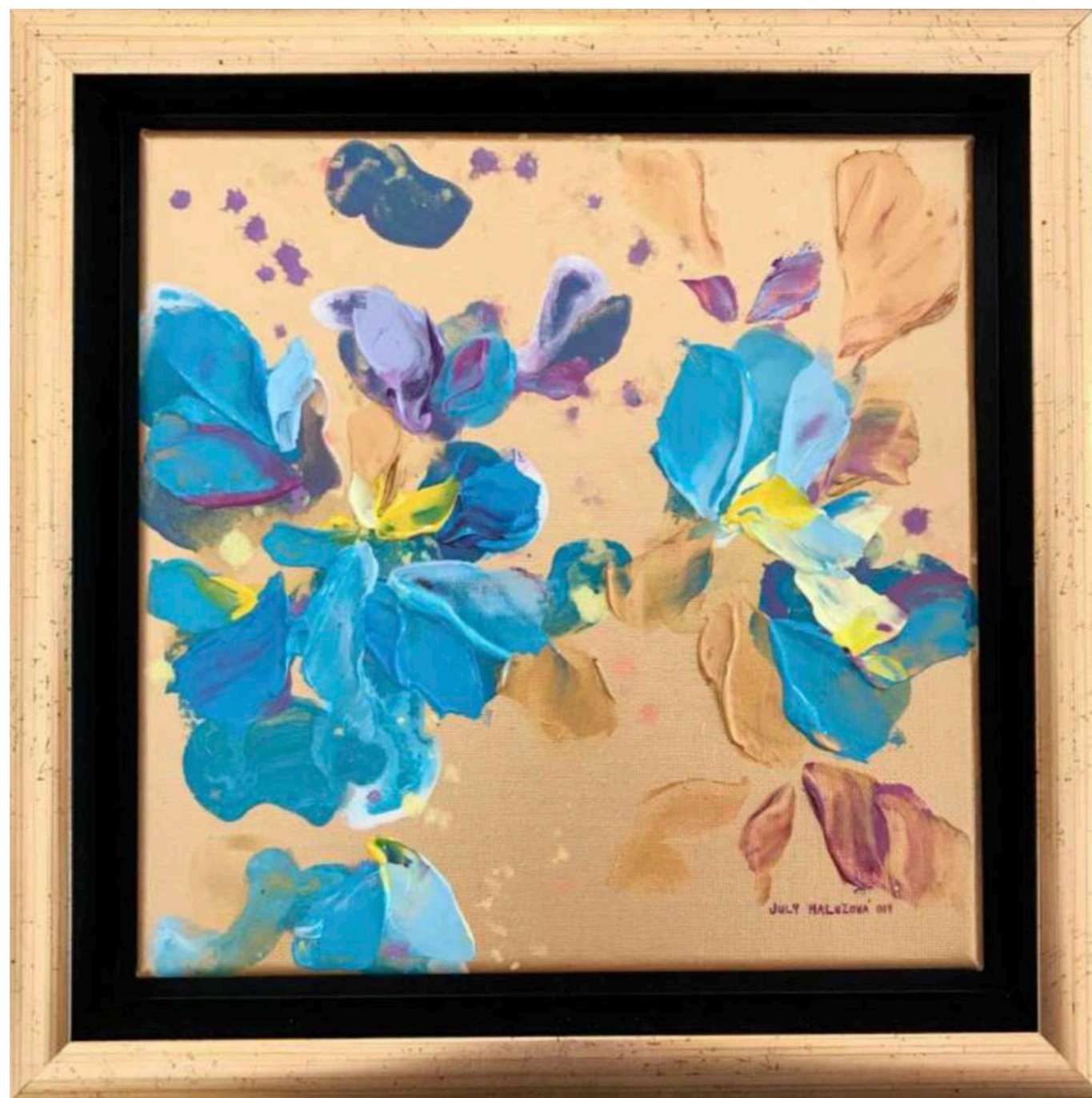
Candy X. Akryl na plátne 20 x 20 cm, 2019 350 eur