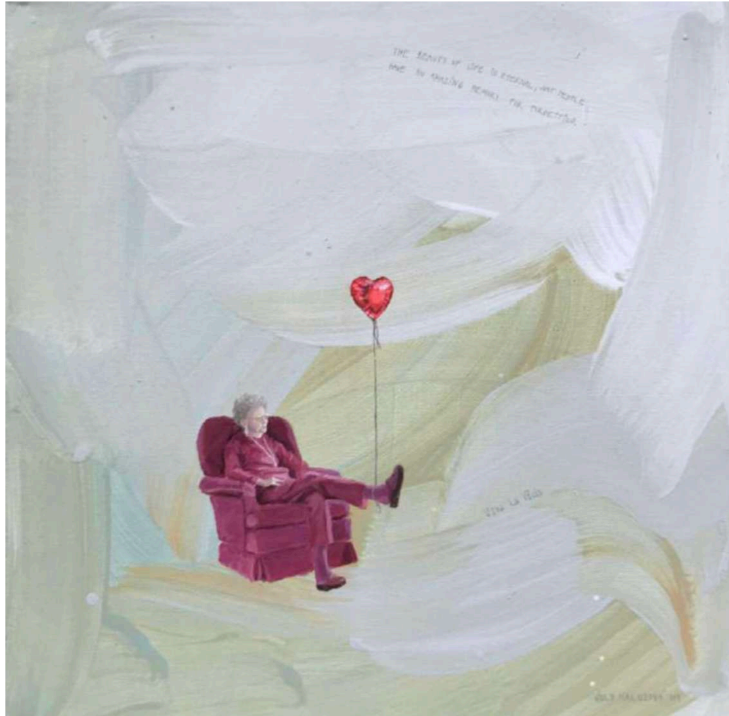
Viva la Vida 30x30 cm Acrylic on Canvas, 2019 450 eur