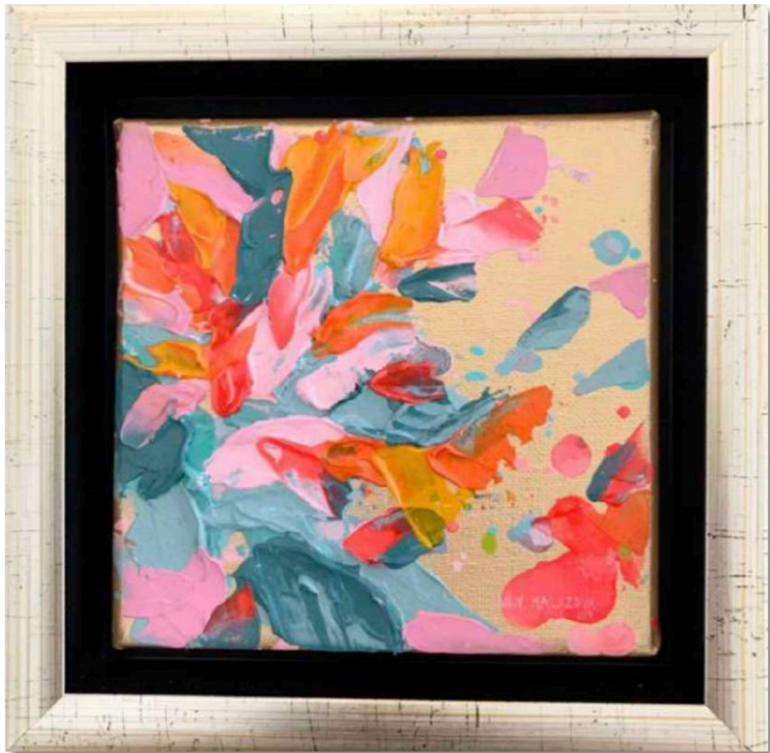
Candy I. Akryl na plátne 12 x 12 cm, 2019 250 eur