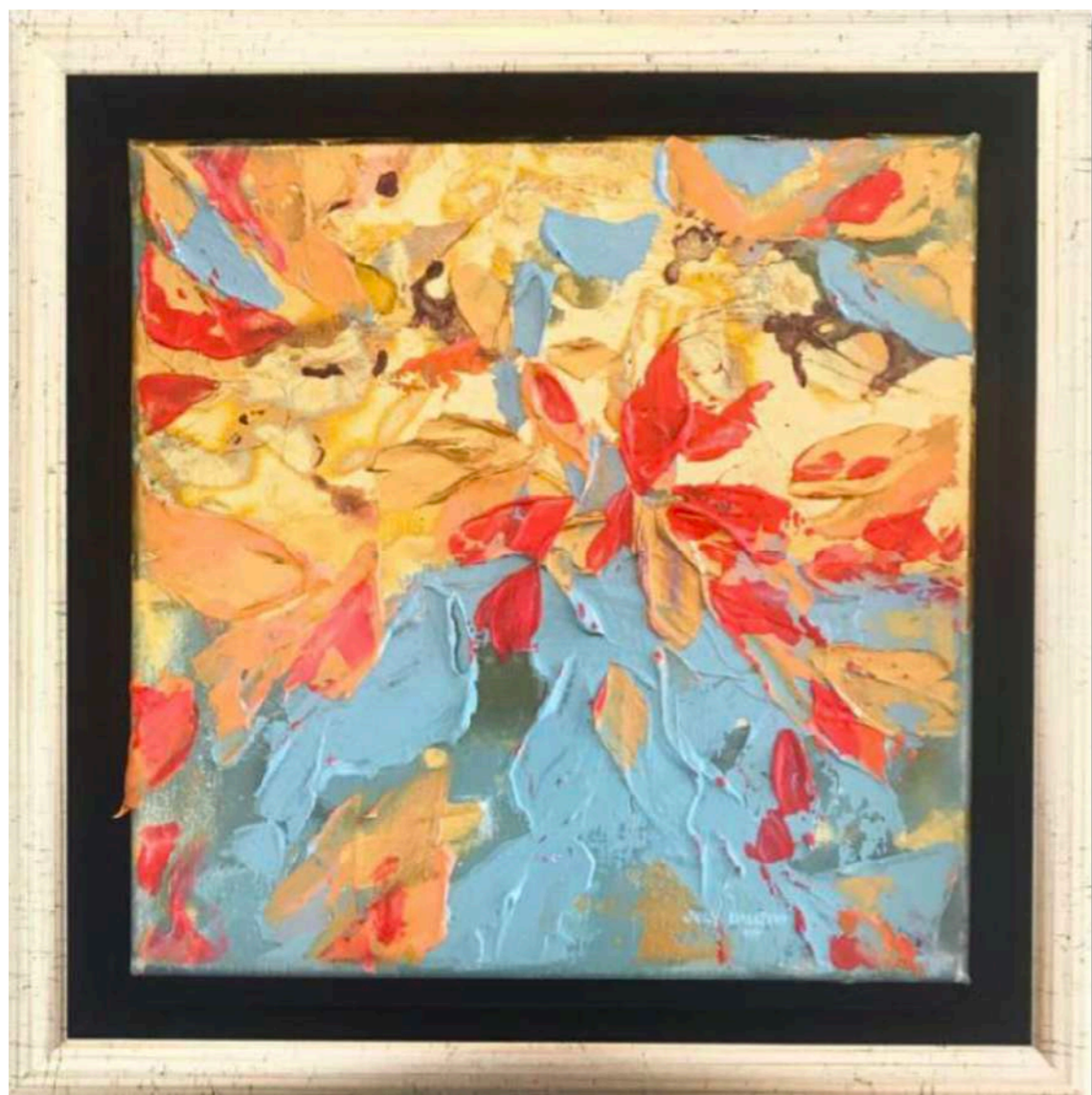
Candy III. Akryl na plátne 20 x 20 cm, 2019 350 eur