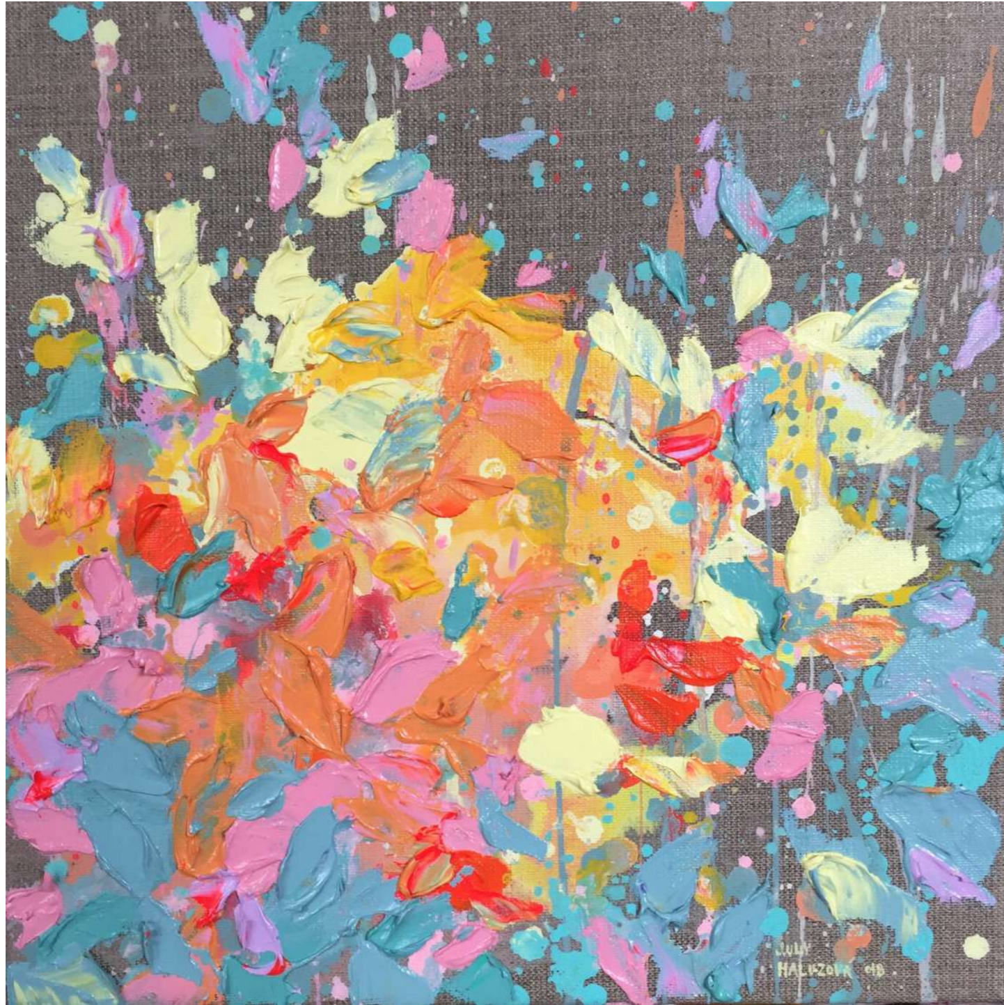
Spring I. 30x30 cm Acrylic on Canvas, 2018 450 eur