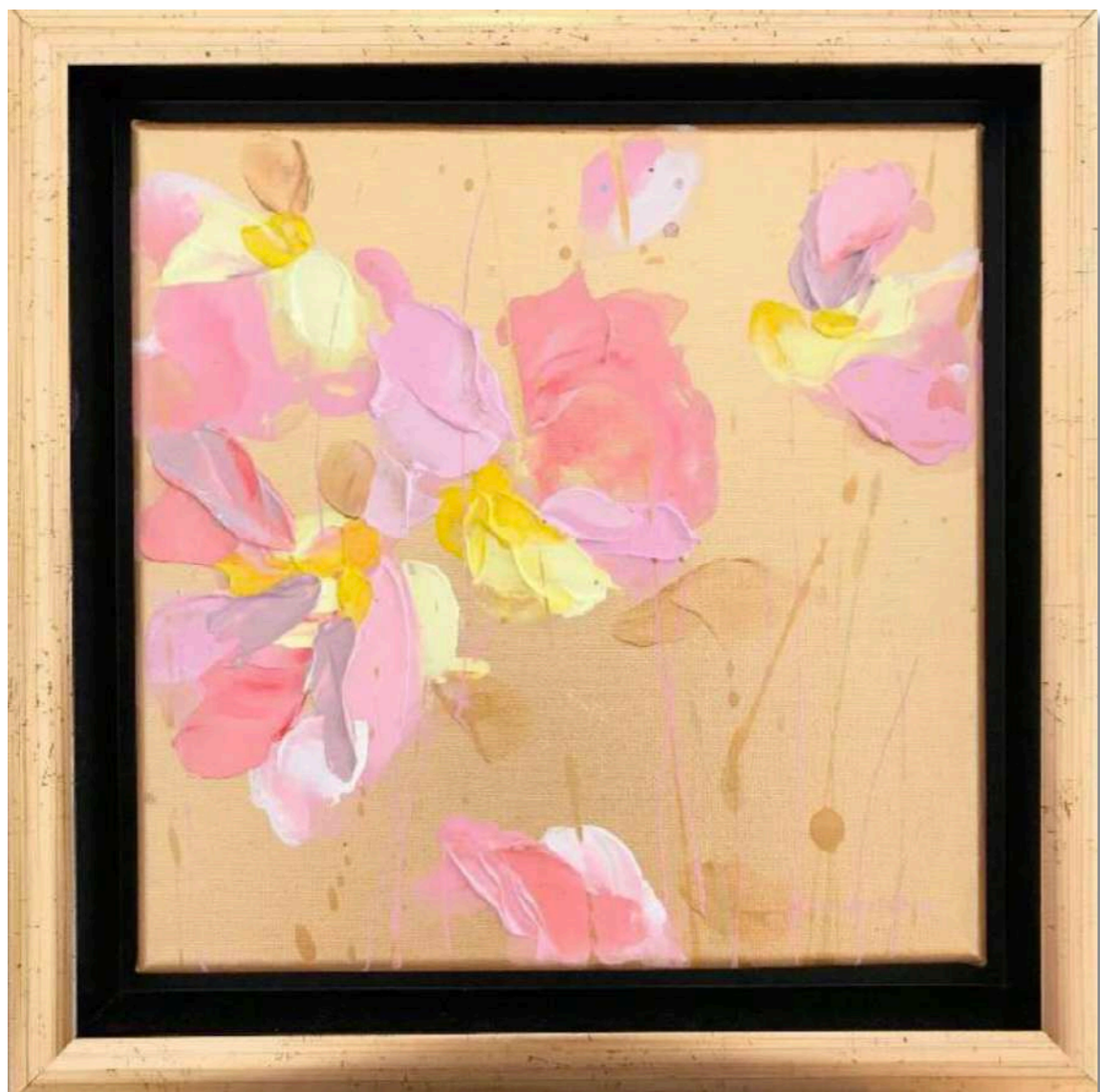
Candy VIII. Akryl na plátne 20 x 20 cm, 2019 350 eur