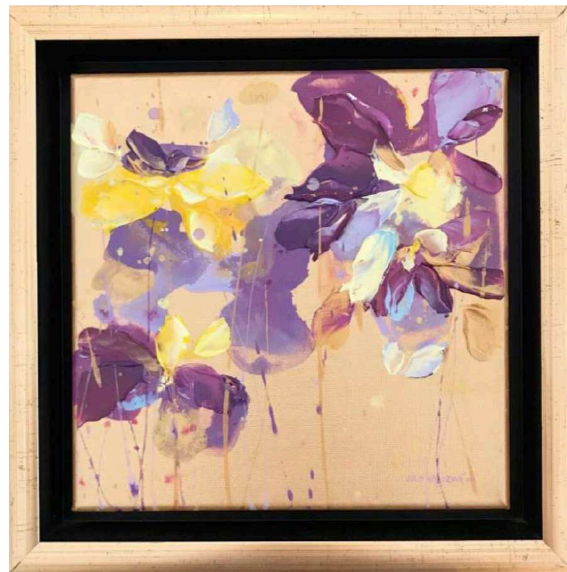
Candy IX. Akryl na plátne 20 x 20 cm, 2019 350 eur