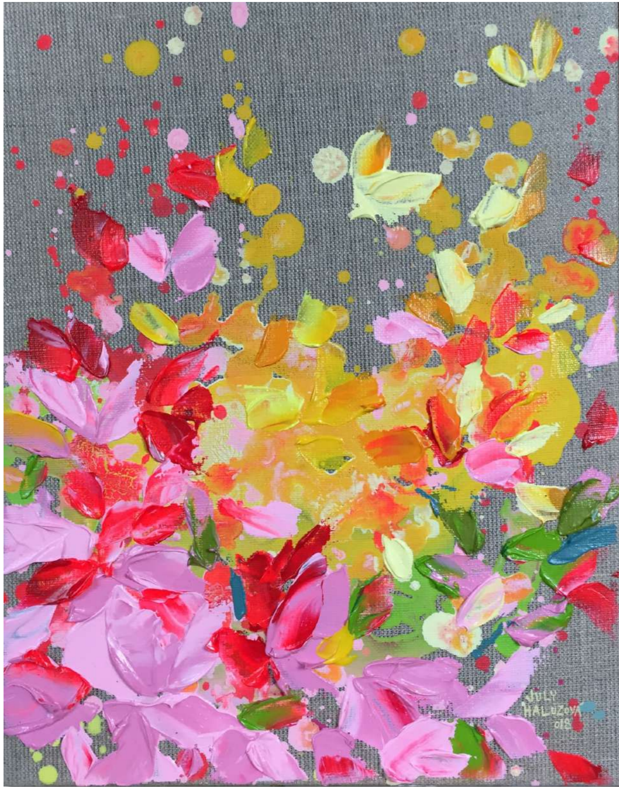
Spring II. 30x24 cm Acrylic on Canvas, 2018 500 eur