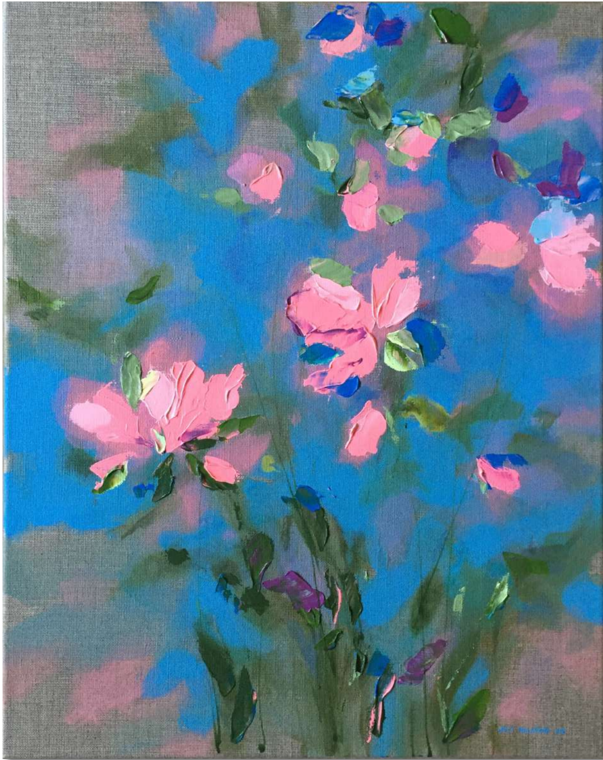
Summer XI. 50x40 cm Acrylic on Canvas, 2018 800 eur