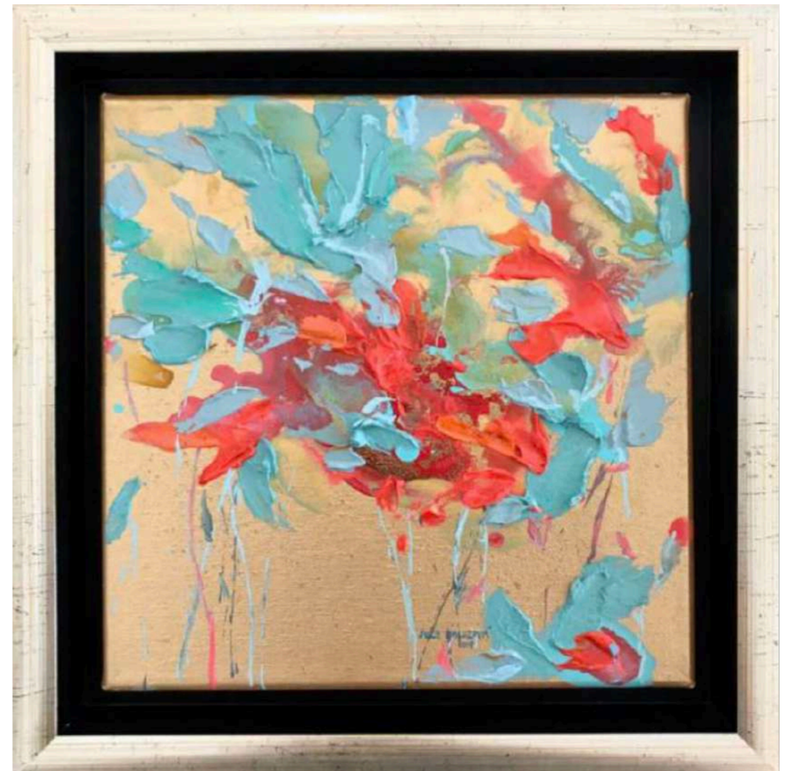
Candy II. Akryl na plátne 20 x 20 cm, 2019 350 eur