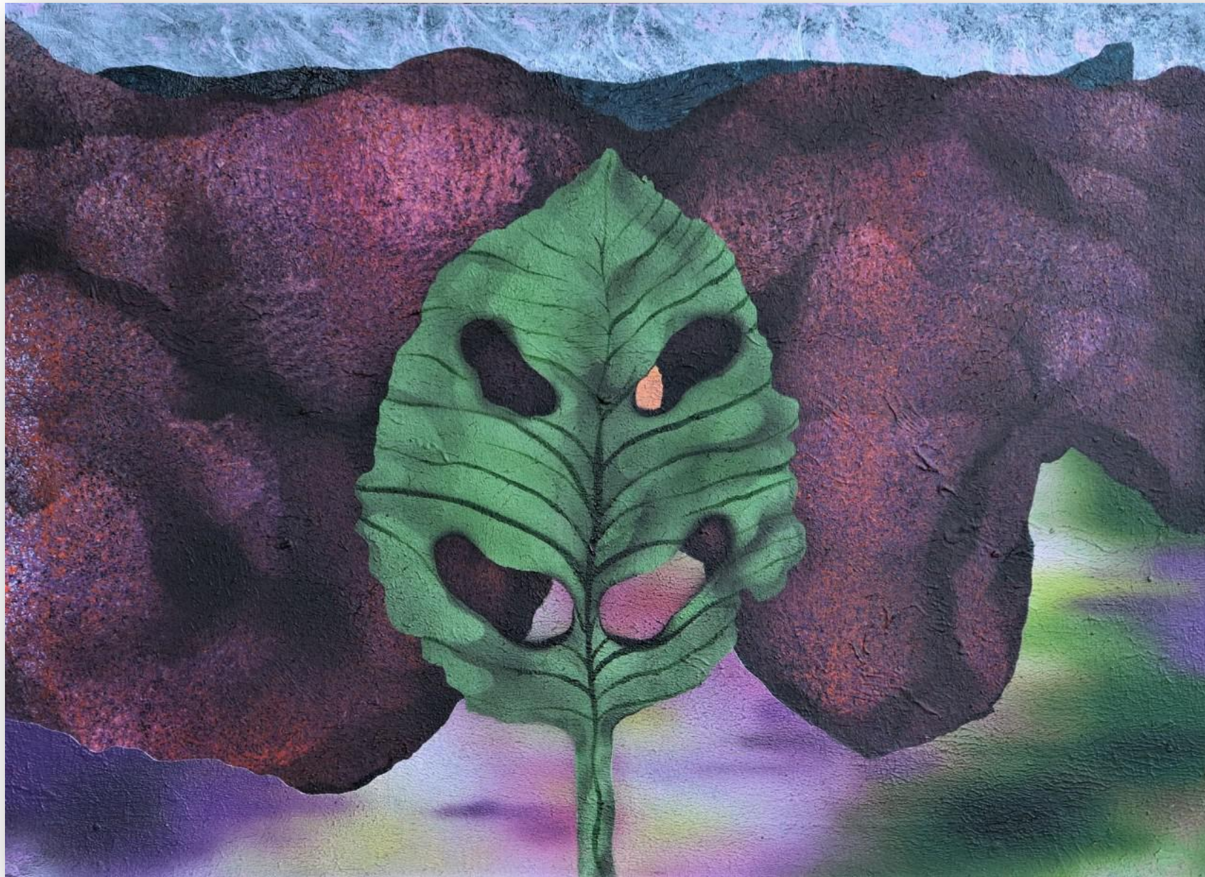
Klub milovníkov rastlín 50 x 70 cm acrylic on canvas, 2020