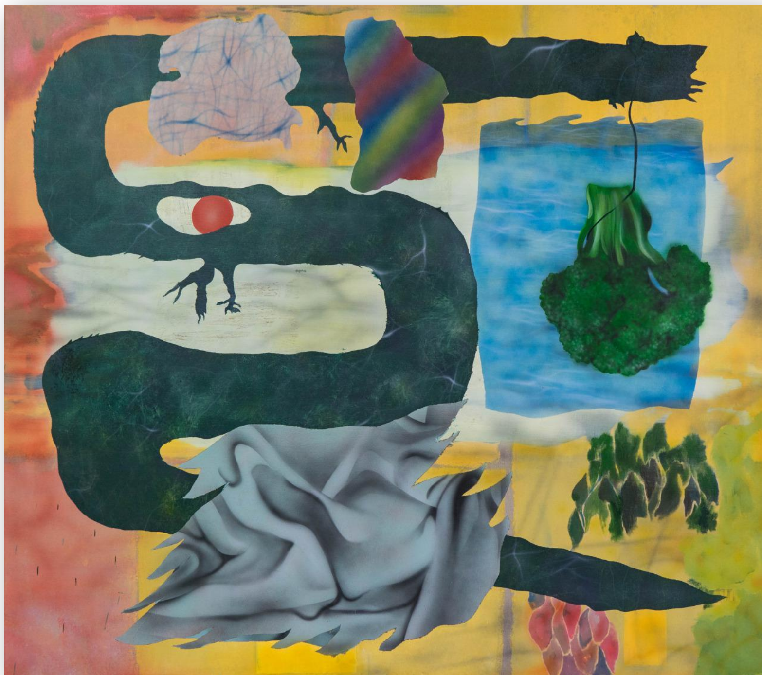
Na konáriku 150 x 170 cm akryl na plátne, 2019