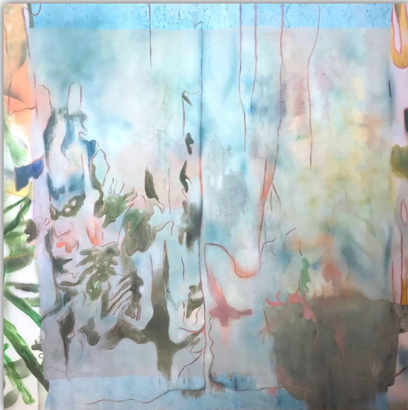
Útočisko 165 x 180 cm kombinovaná technika, 2019