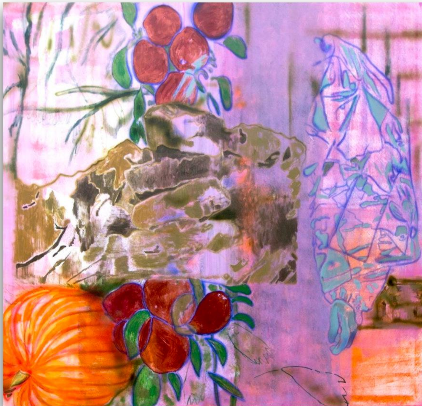
Plody 145 x 155 cm akryl na plátne, 2017