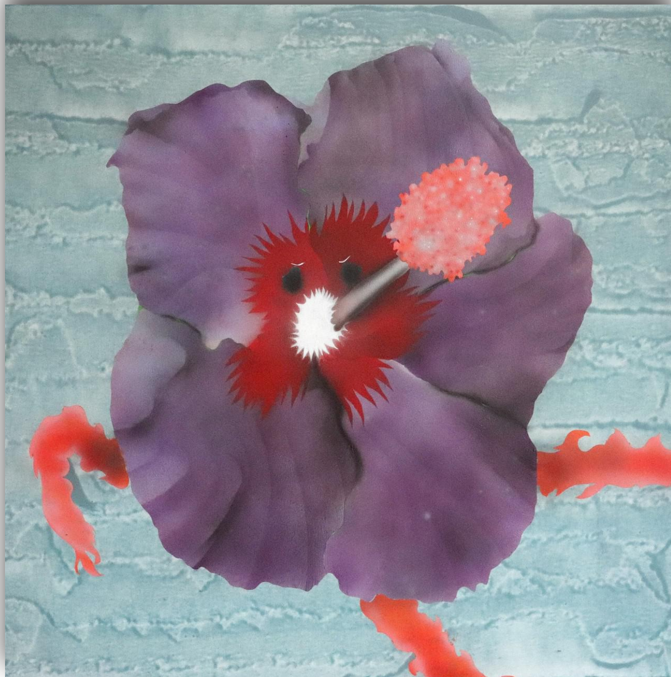
Angry flower II. 100 x 100 cm akryl na plátne, 2019