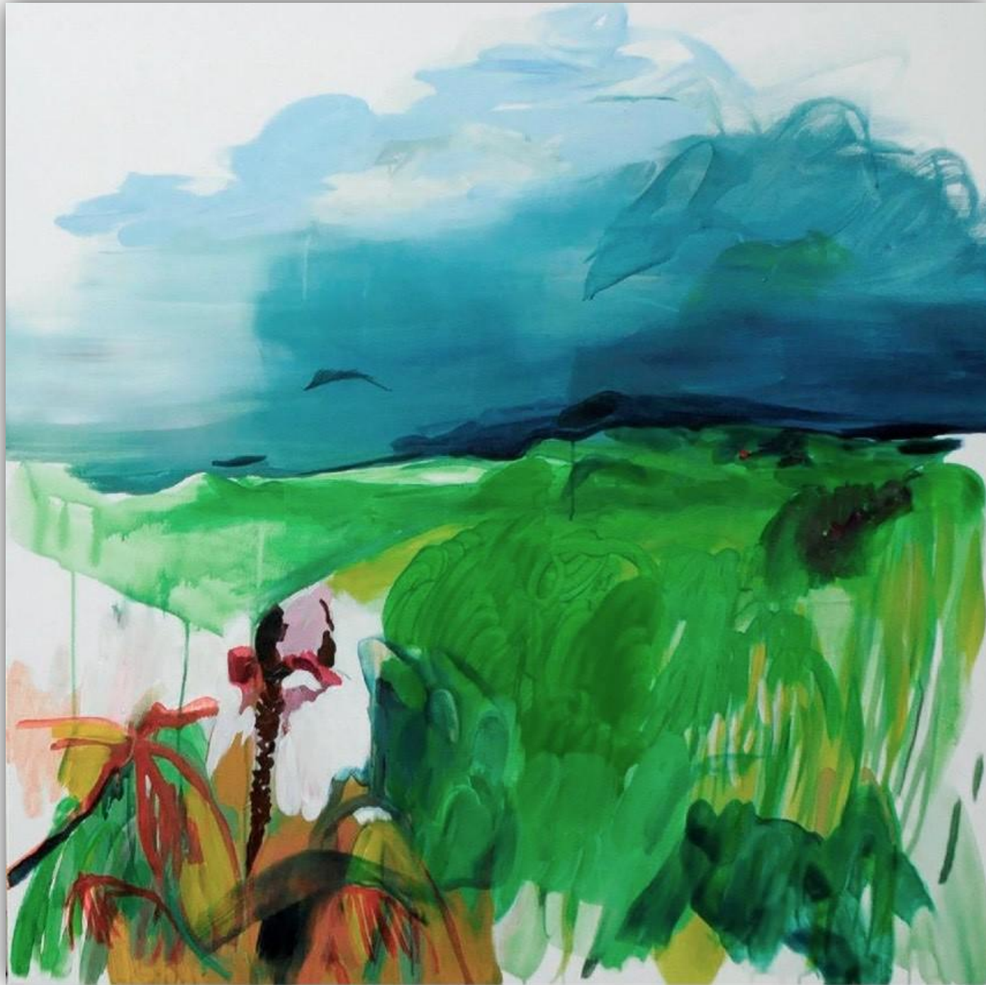
Lúka 120x115 cm acryl on canvas, 2013