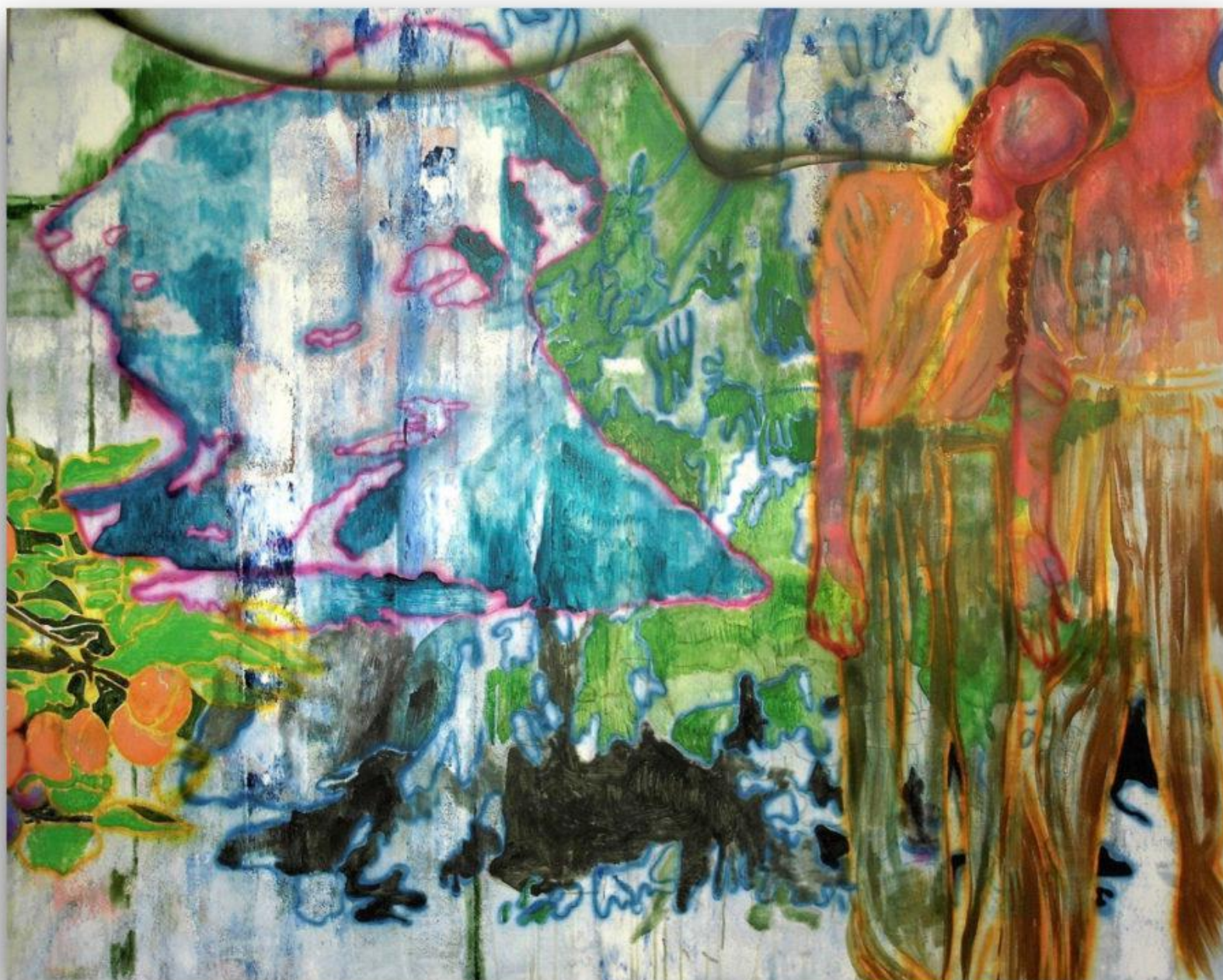
Budovanie svetlejších zajtrajškov 160 x 200 cm akryl na plátne, 2017