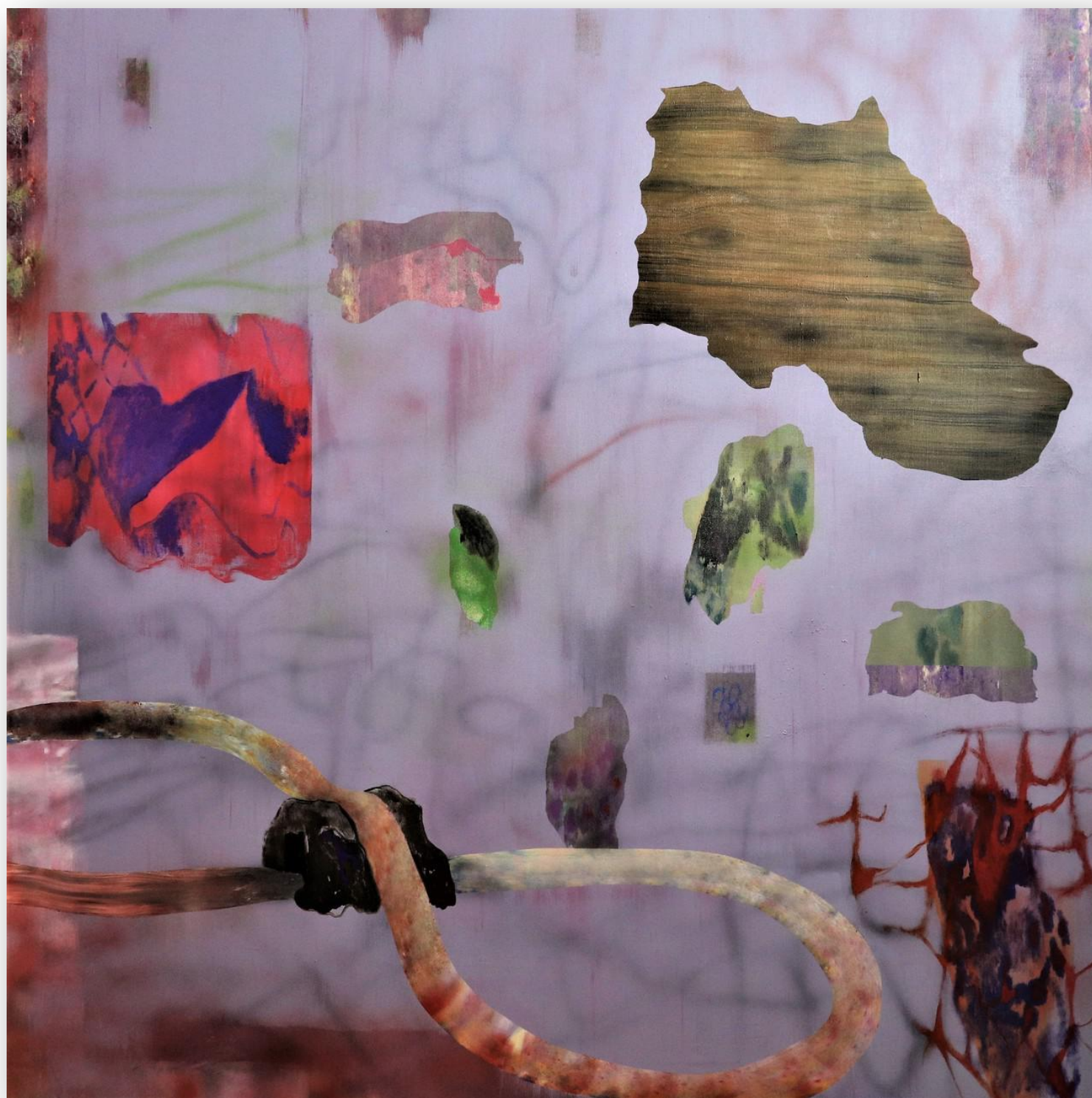
Krajinomaľba 160 x 160 cm akryl na plátne, 2019