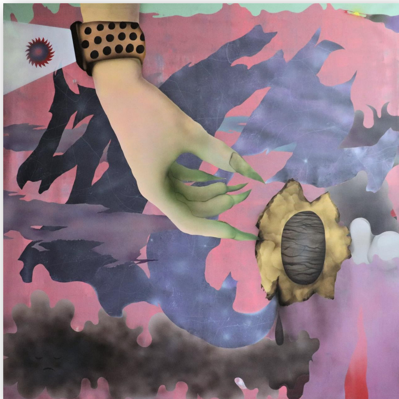
Rituál II. 190 x 190 cm akryl na plátne, 2020