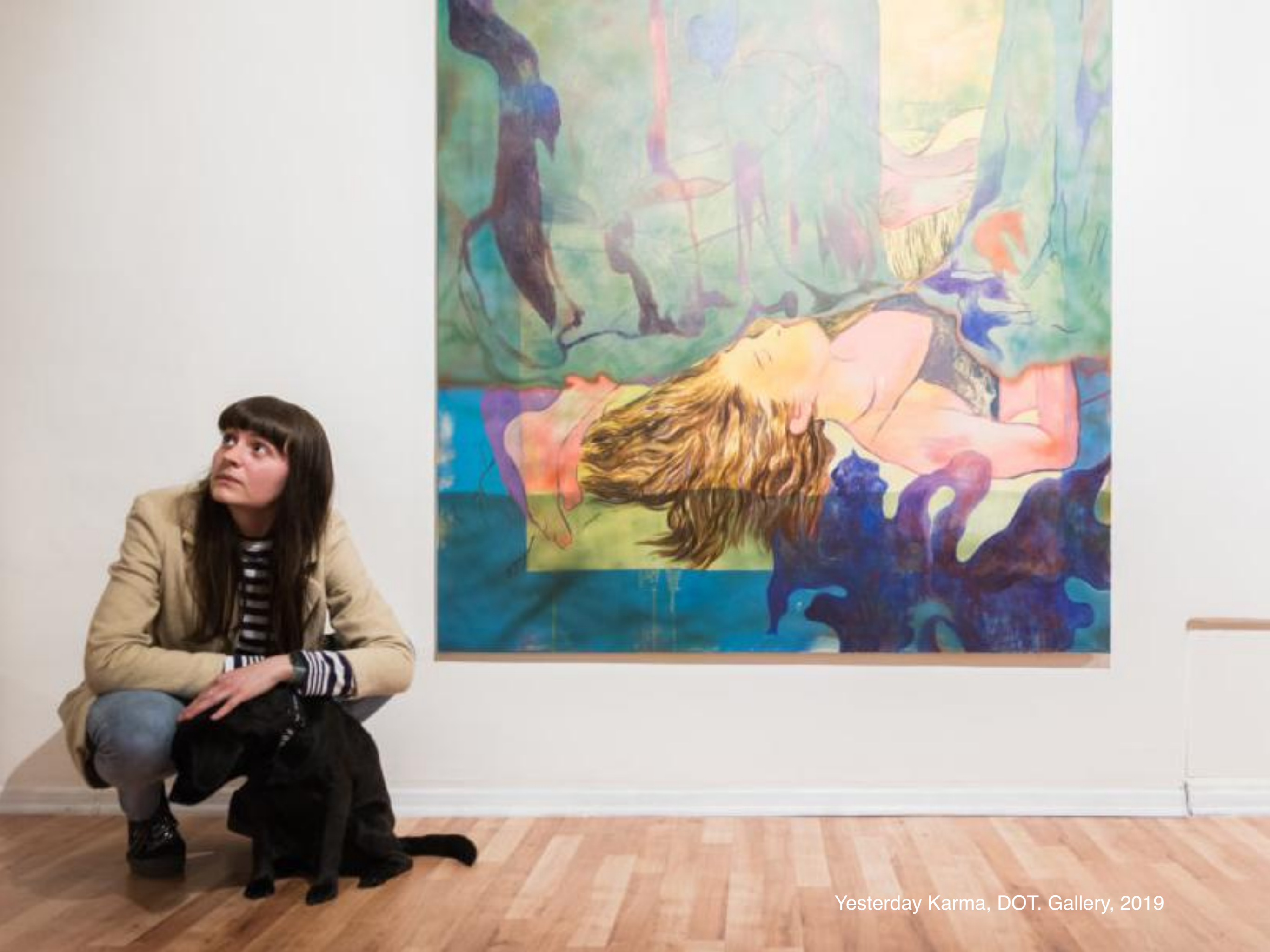
Yesterday Karma, DOT. Gallery, 2019