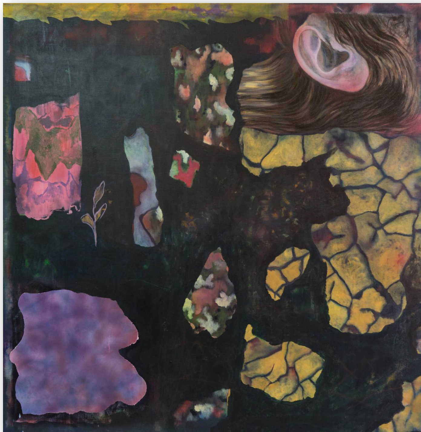
Zemina 160 x 160 cm akryl na plátne, 2019