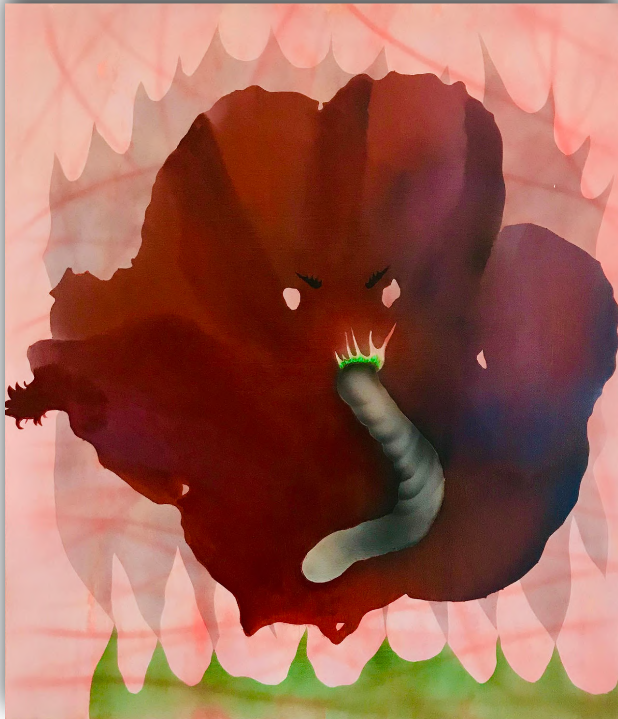
Angry flower 70 x 60 cm akryl na plátne, 2020