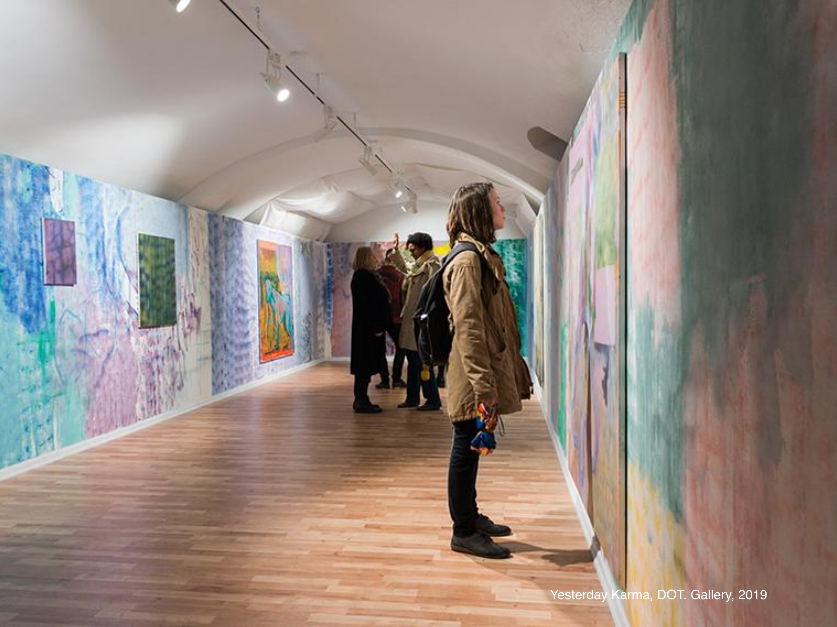
Yesterday Karma, DOT. Gallery, 2019