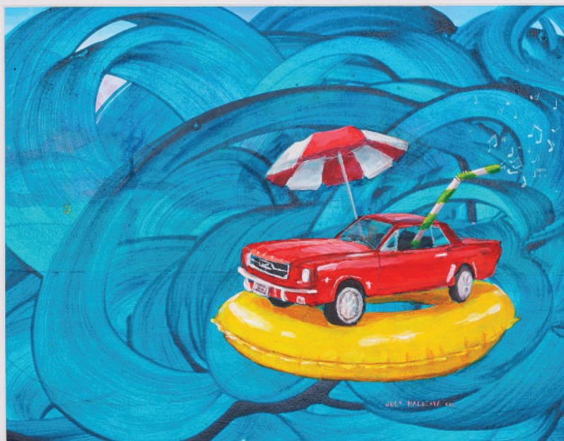
July Haluzová Prázdniny akryl na papieri, 29 × 21 cm, 2021 350 Eur + DPH