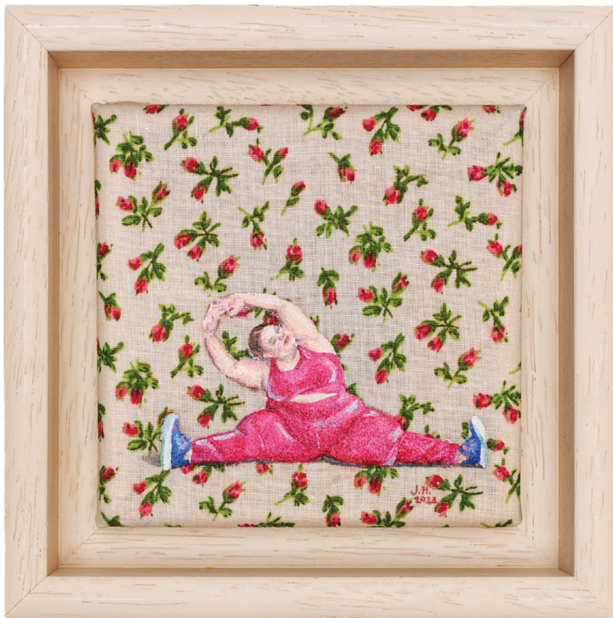
July Haluzová Fragile flower V olej na textílii, 10 × 10 cm, 2023 300 Eur + DPH