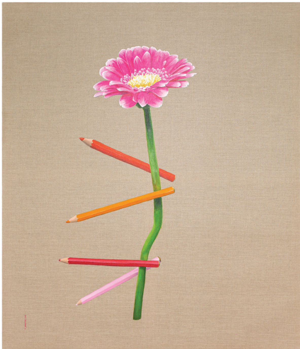
July Haluzová What use are flowers III akryl na plátne, 120 × 140 cm, 2021 Predané