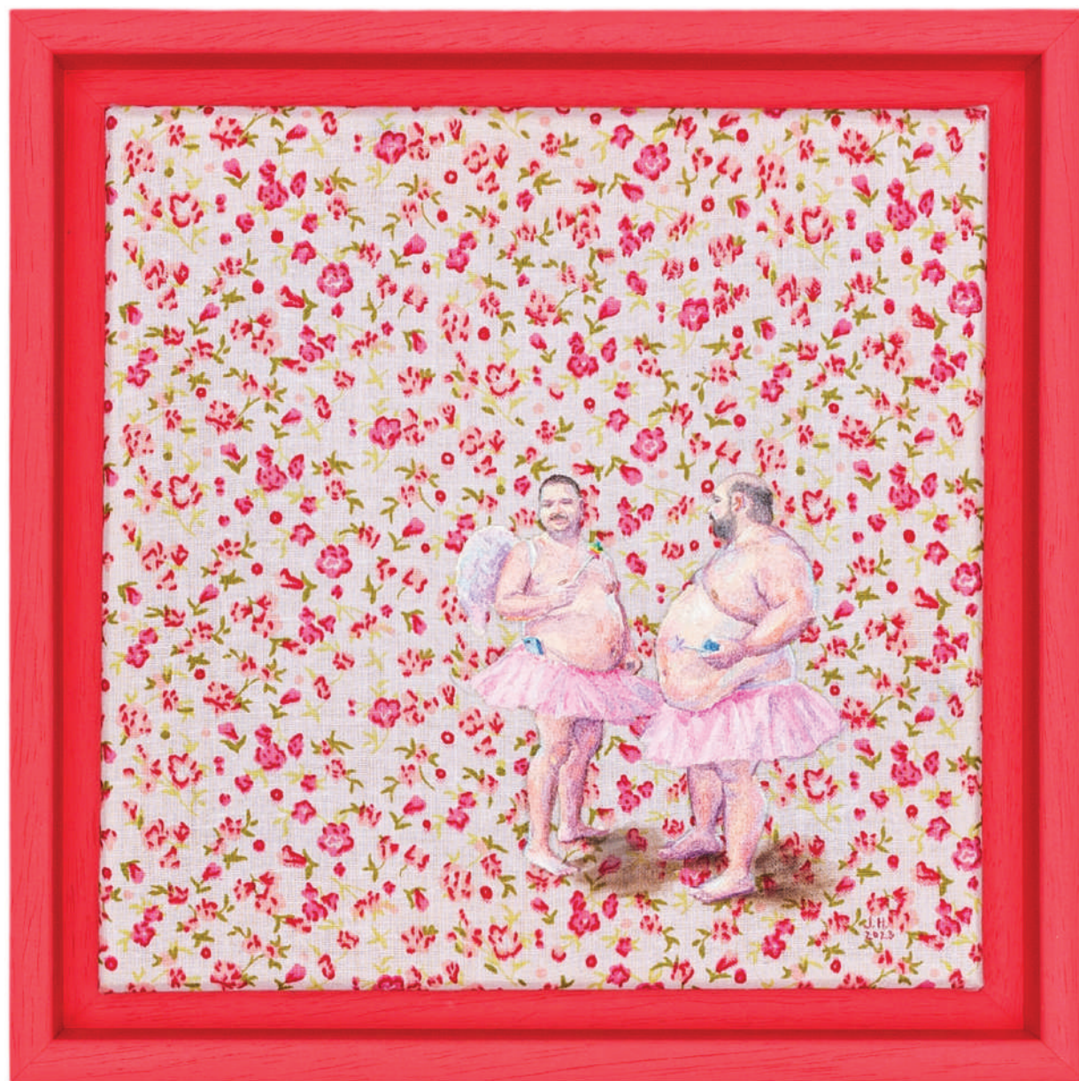
July Haluzová Fragile flower IX olej na textílii, 20 × 20 cm, 2023 600 Eur + DPH