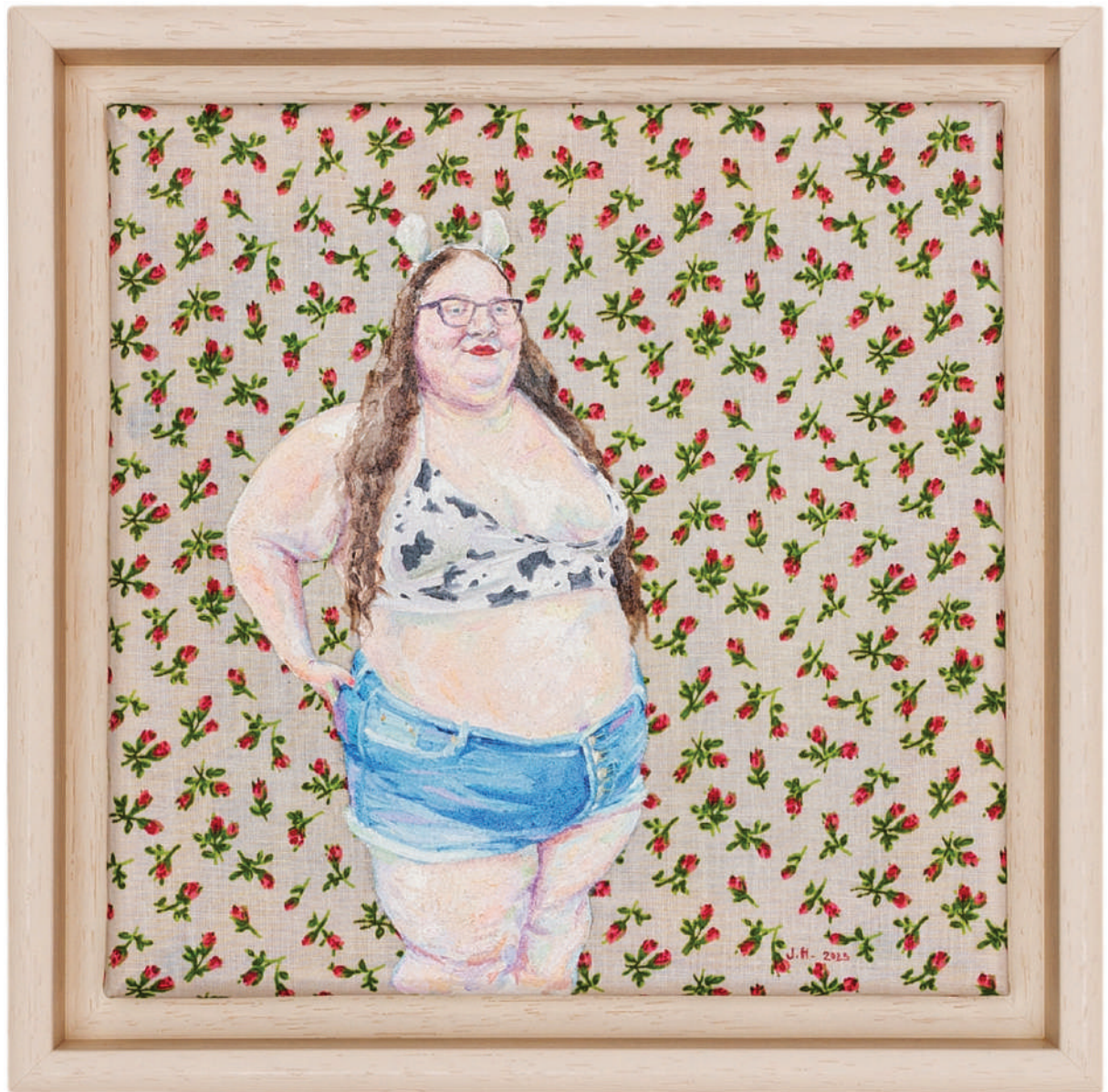
July Haluzová Fragile flower VII olej na textílii, 20 × 20 cm, 2023 600 Eur + DPH