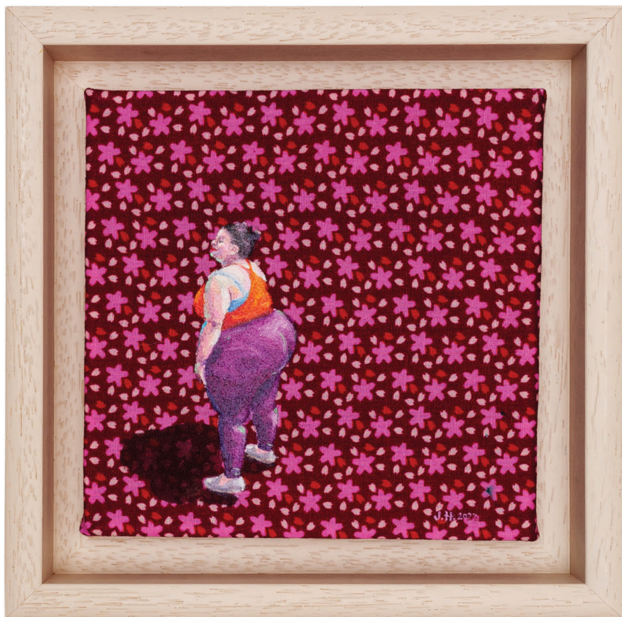
July Haluzová Fragile flower IV olej na textílii, 15 × 15 cm, 2023 400 Eur + DPH