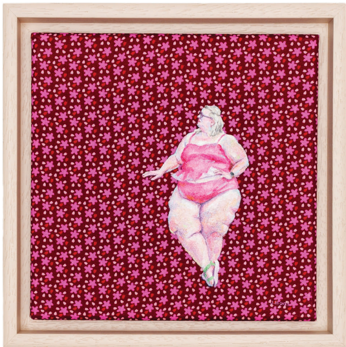
July Haluzová Fragile flower VIII olej na textíli, 20 × 20 cm, 2023 600 Eur + DPH