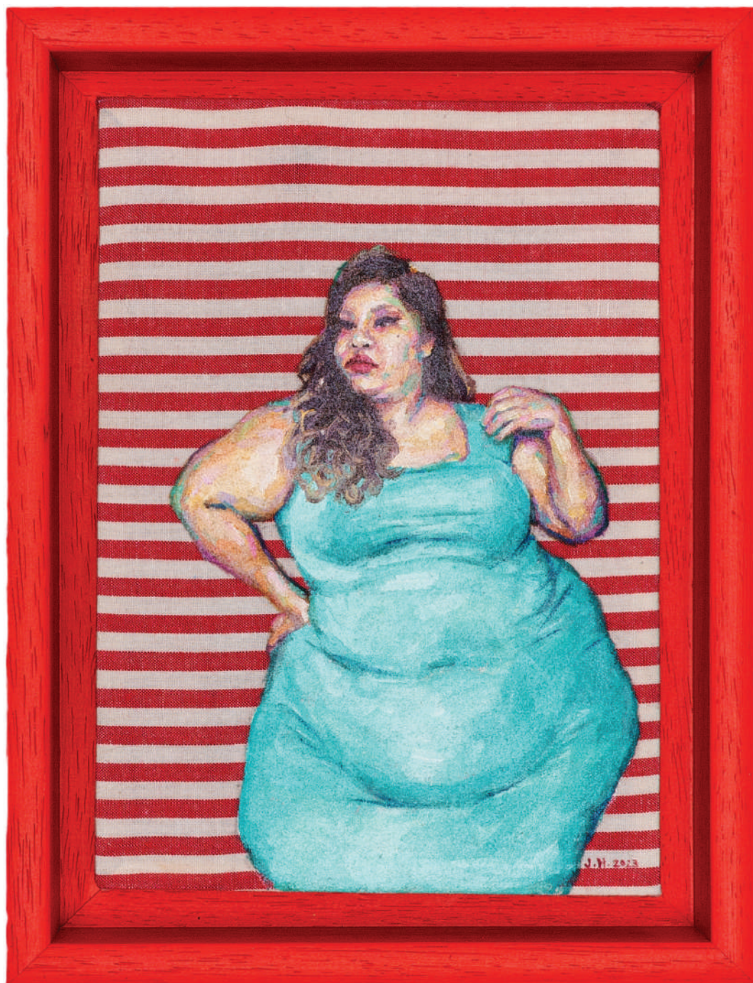
July Haluzová Fragile flower I olej na textílii, 18 × 15 cm, 2023 550 Eur + DPH