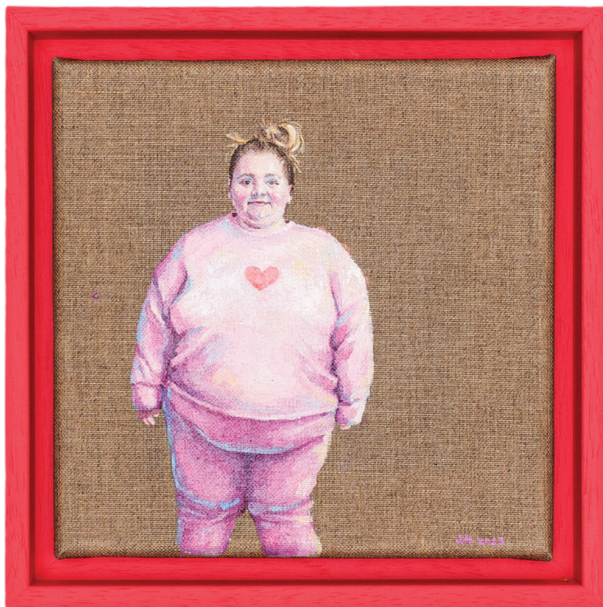
July Haluzová Fragile flower III olej na textílii, 20 × 20 cm, 2023 650 Eur + DPH