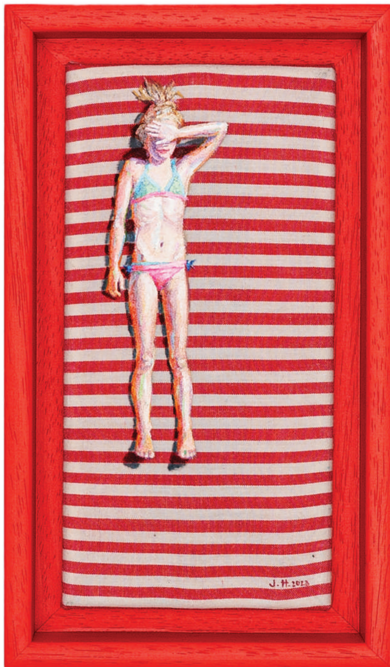
July Haluzová Fragile flower II olej na textílii, 20 × 10 cm, 2023 500 Eur + DPH