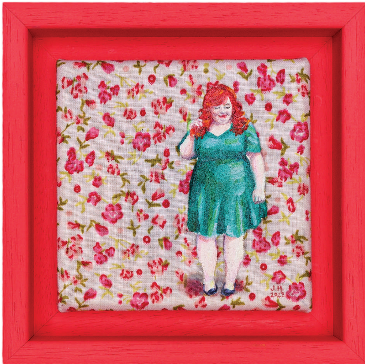
July Haluzová Fragile flower VI olej na textílii, 10 × 10 cm, 2023 300 Eur + DPH