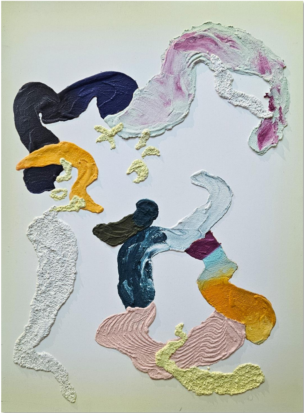
Move III. 60 x 80 cm Kombinovaná technika na plátne, 2024 3 650 eur