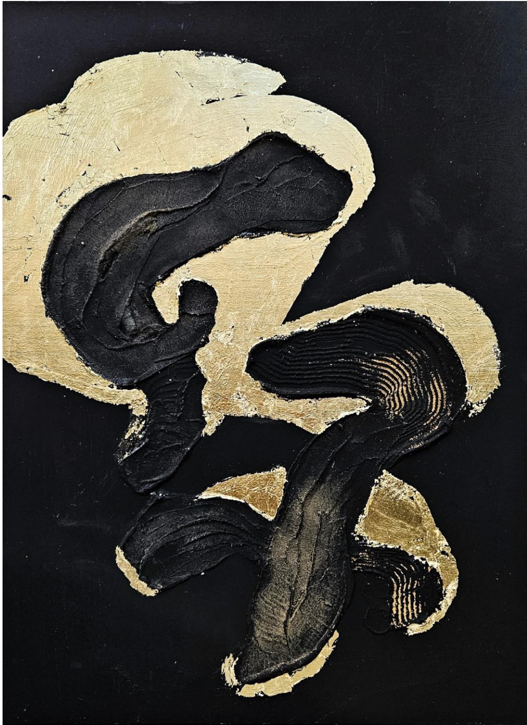
Grace 80 x 60 cm Kombinovaná technika na plátne, zlato, 2024 3 650 eur