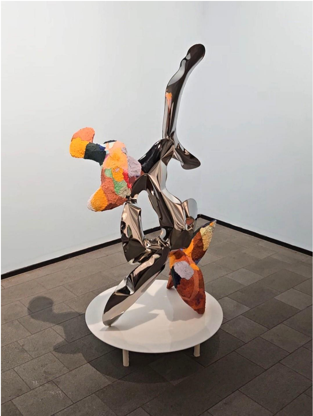
AISI 304 Spoluautor Robin Fisher leštená nerez, striebro, a pastovité omietky cena na vyžiadanie