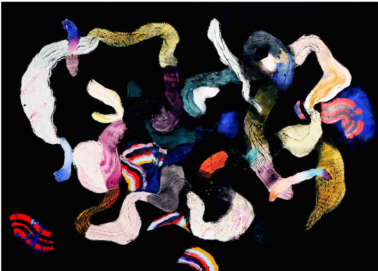
Got to be real 100 x 140 cm Kombinovaná technika na plátne, 2023 6 200 eur