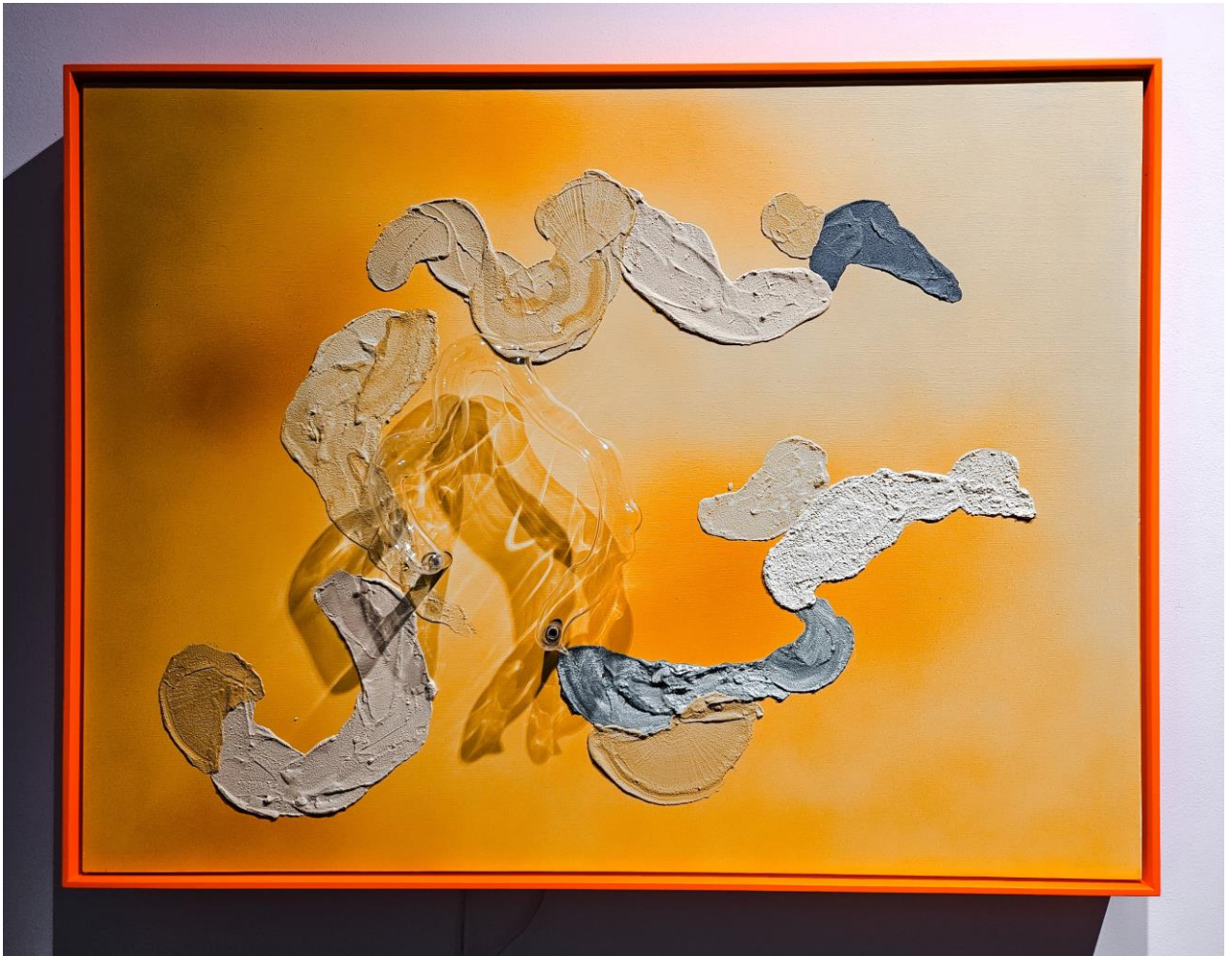
Back to soul II. 90 x 120 cm pastovitá omietka a akryl na plátne, neón, 2023 7 095 eur