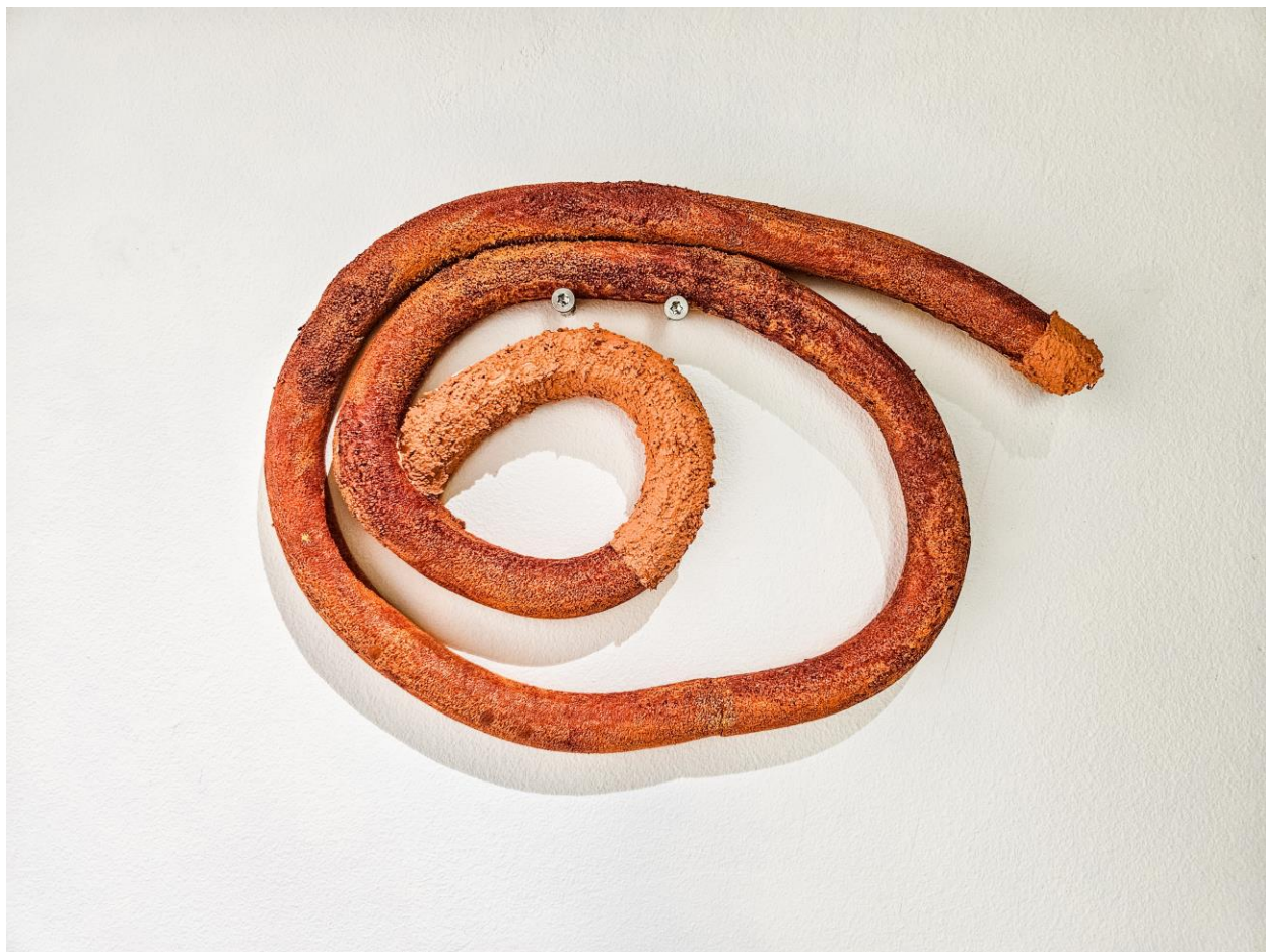
Spiral 40 x 30 cm Kolorovaný beton, 2023 1 020 eur