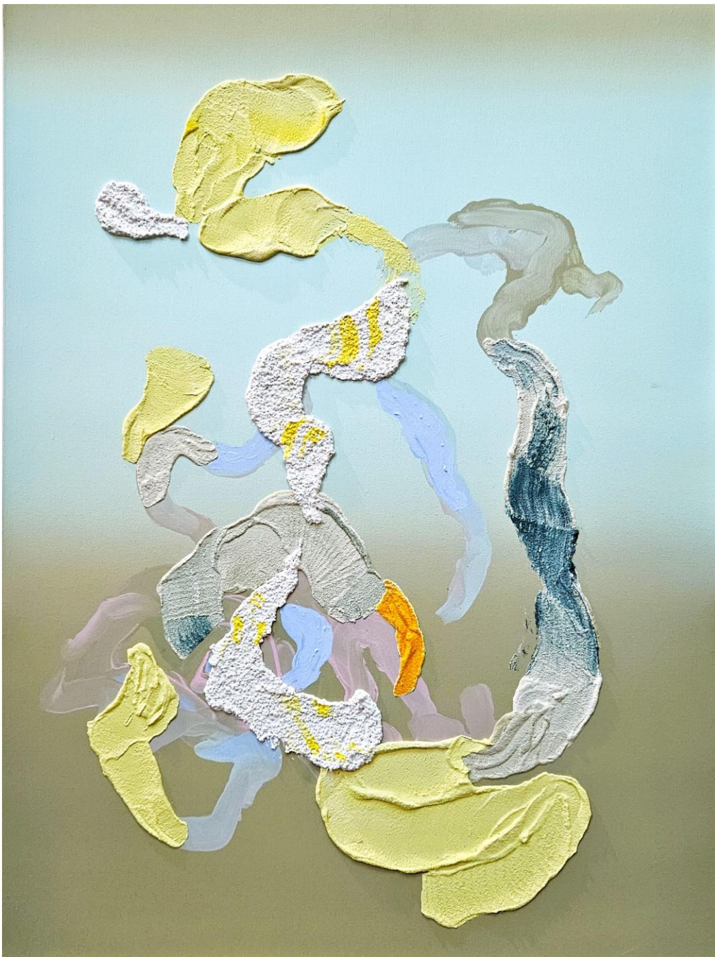
Move II. 60 x 80 cm Kombinovaná technika na plátne, 2024 3 650 eur