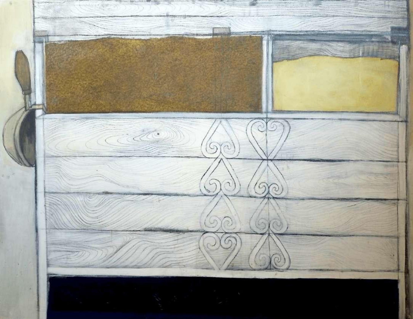
Lada na ovos a šrot 100 x 140 cm vajíčková tempera a tuha na sololite 1 227 eur