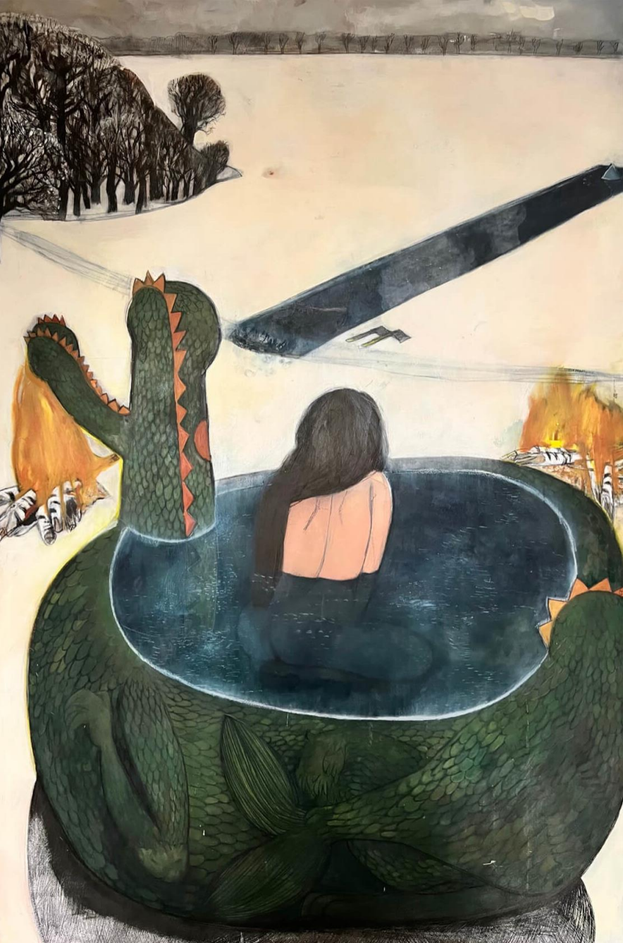
Medvedia hora 200 x 140 cm kombinovaná technika na preglejke 3 557 eur