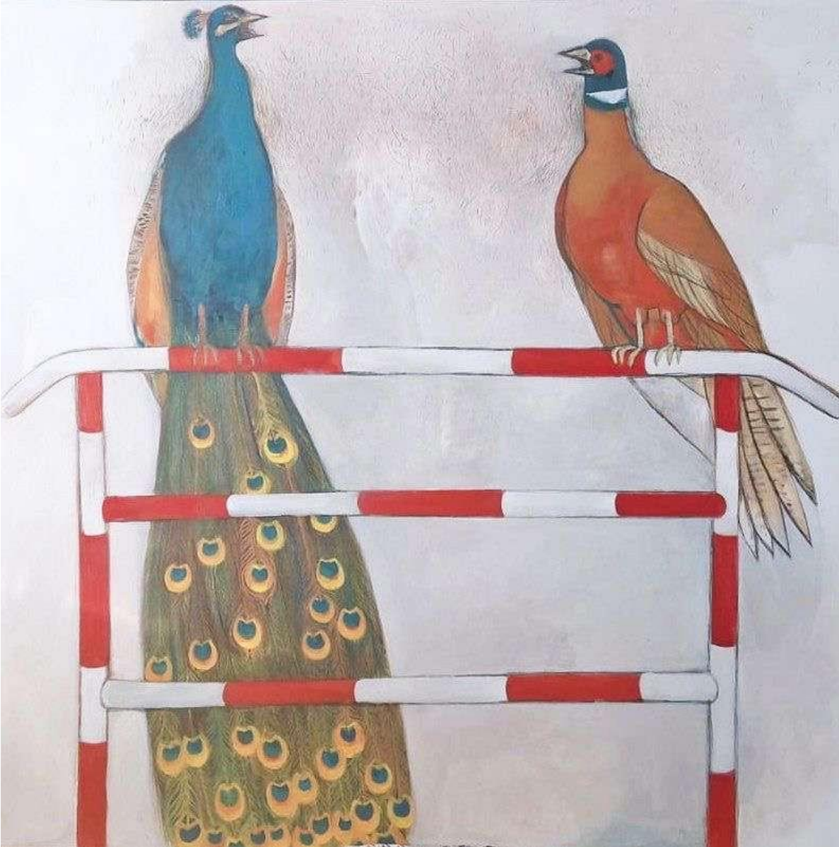
Páv a bažant podľa vzoru dub 140 x 140 cm kombinovaná technika na sololite