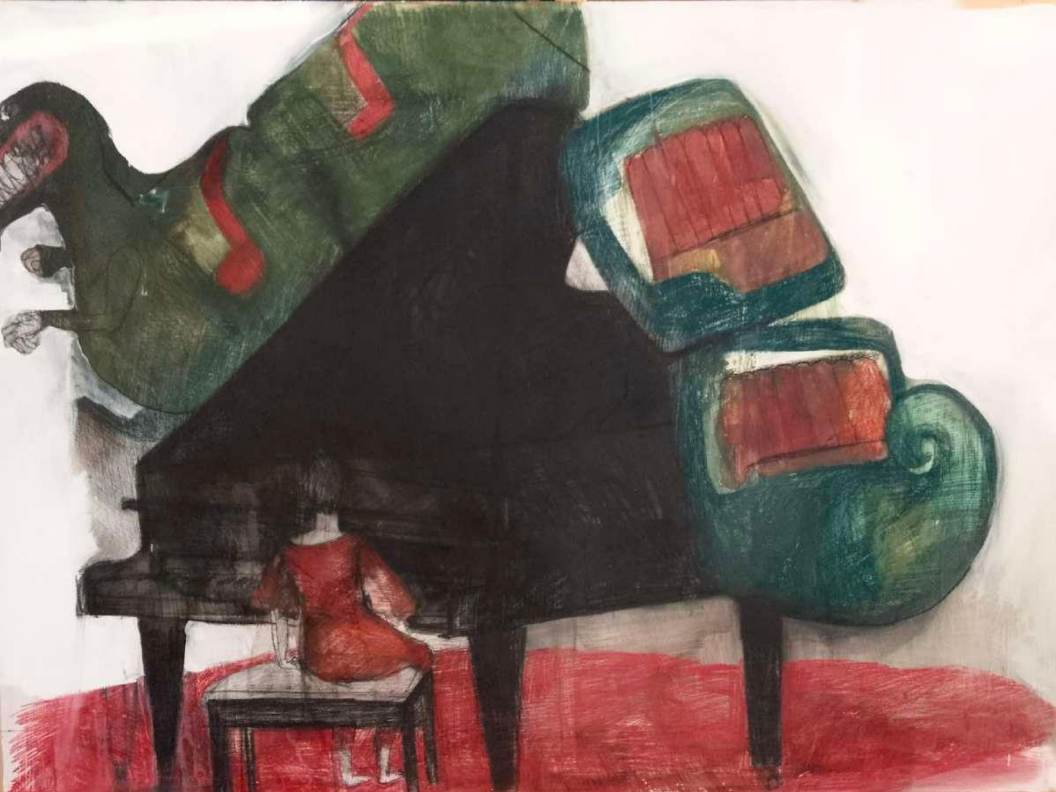
Klavír 70 x 100 cm kombinovaná technika na sololite SOLD