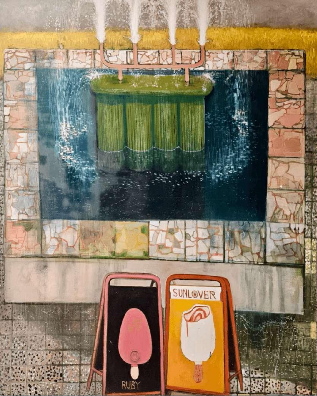
Fontána pre Zuzanu II. 207 x 140 cm olej na sololite