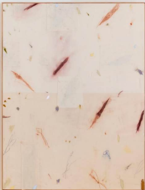
"030724" 200 x 150 cm Olej, pastel a gesso na plátne 5 965 eur