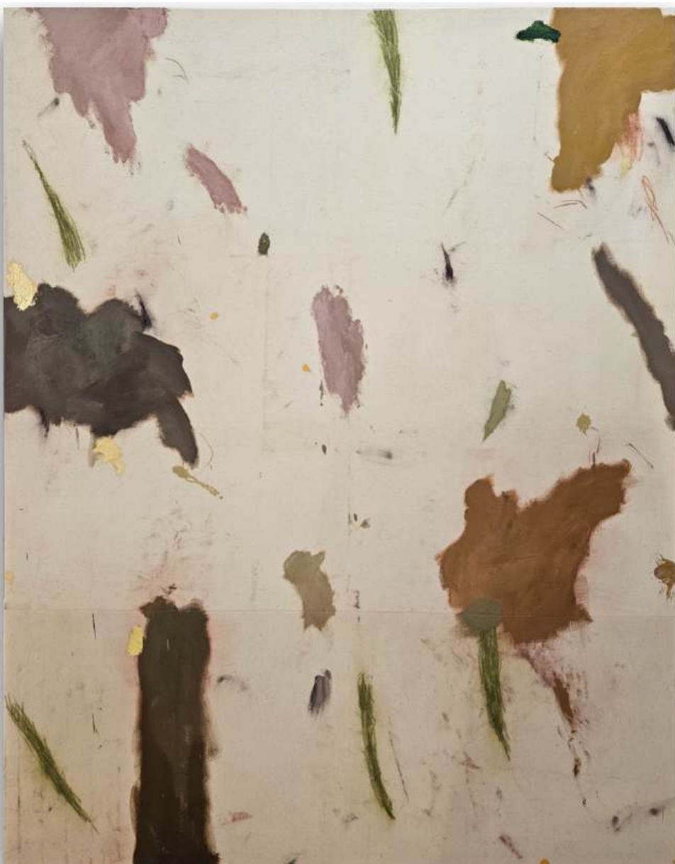
“010126” 190 x 150 cm Olej, pastel a gesso na plátne 5 550 eur