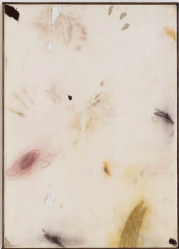
"040825" 50 x 70 cm Olej, pastel a gesso na plátne 2 050 eur