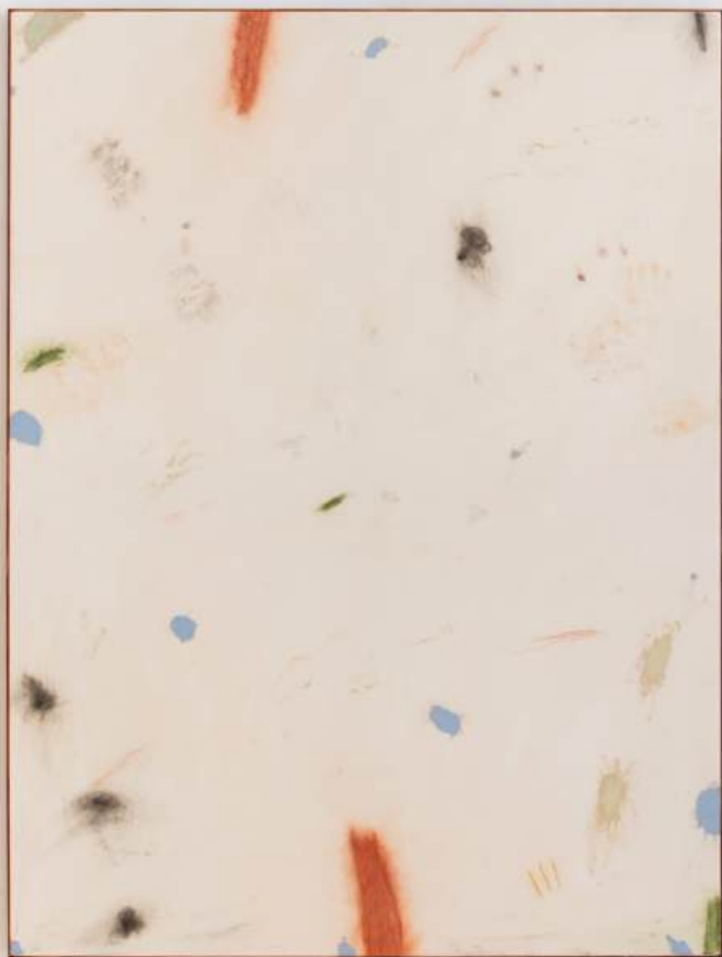
“050825” 200 x 150 cm Olej, pastel a gesso na plátne 5 965 eur