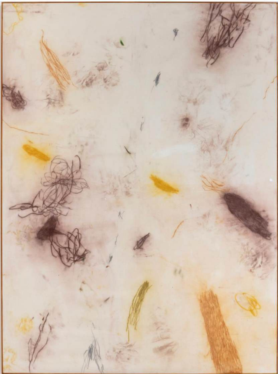
Untitled 140 x 190 cm Olej, pastel a gesso na plátne 5 550 eur